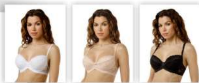
Белый Серебристый пион Чёрный

* возможны другие цвета в сезонных предложениях