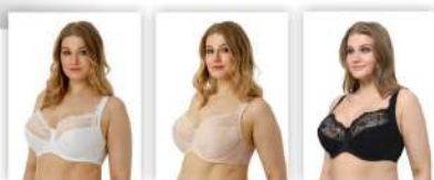
Белый Серебристый пион Чёрный

* возможны другие цвета в сезонных предложениях