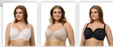
Белый Серебристый пион Чёрный * возможны другие цвета в сезонных предложениях