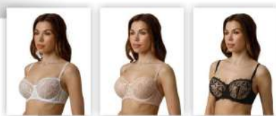
Белый Серебристый пион Чёрный

* возможны другие цвета в сезонных предложениях