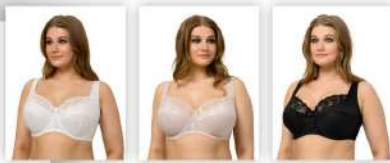
Белый Серебристый пион Чёрный * возможны другие цвета в сезонных предложениях