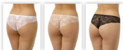
Белый Серебристый пион Чёрный

* возможны другие цвета в сезонных предложениях