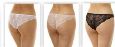
Белый Серебристый пион Чёрный

* возможны другие цвета в сезонных предложениях