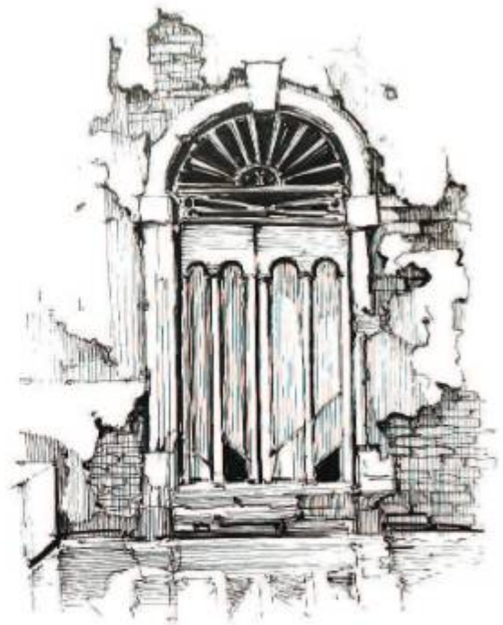
Дверь в Венеции

Если с первого раза замахнуться на большой дом или улицу, то вы рискуете запутаться в перспективе, количестве деталей и в конце концов потерять интерес к своей работе. Чтобы такого не случилось, действуйте осторожно, как сталкер, рассчитывайте свои силы, время и возможности.