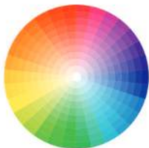
ЦВЕТОВОЙ КРУГ По насыщенности

Сейчас я вас шокирую. Первая вещь, о которой мы поговорим, — это цвет. Очевидно, правда?