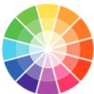
ЦВЕТОВОЙ КРУГ Базовое цветовое колесо