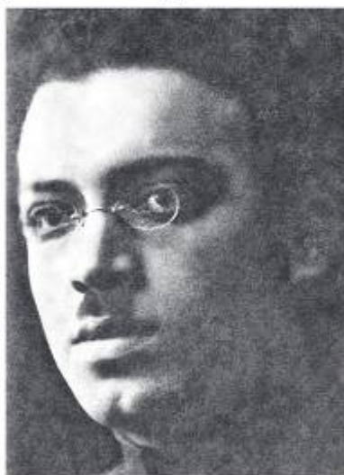
Абрам Аронович Слуцкий (1898–1938) — деятель советской разведки, комиссар государственной безопасности 2-го ранга (1935). Руководитель Иностранного отдела (внешняя разведка) ГУГБ НКВД СССР (1935–1938). Убит сотрудниками НКВД во время репрессий в НКВД 1937–1938 годов.

ведуправление Красной армии, отдел международной связи Коминтерна и Специальная группа особого назначения при наркомате внутренних дел (СГОН) Я. Серебрянского («Группа Яши»). В этих условиях Артузов по совместительству был назначен заместителем начальника военной разведки. Почему? Потому что речь шла о необходимости кардинального укрепления контрразведывательного обеспечения закордонной работы нашей разведки. Опыт Артузова, знание им русской эмиграции, которая была одним из основных источников формирования агентуры, больше всего нужны были в этот период. Вскоре Артузова в качестве начальника ИНО сменяет А. Слуцкий. Артузов возвращается вновь в НКВД в 1937 году в качестве консультанта, рядового сотрудника.