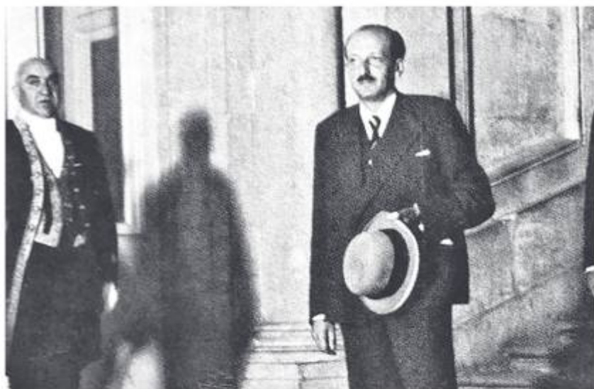
Марсель Израилевич Розенберг (1896–1938) — советский дипломат. Первый представитель СССР в Лиге Наций. Во время Гражданской войны в Испании — полпред СССР при республиканском правительстве.

нако объединенные резидентуры Разведупра и НКВД в канун войны и когда она началась оказались очень уязвимыми. Связники и курьеры зачастую знали агентов, принадлежавших к различным советским спецслужбам. А провалы советской разведки в конце двадцатых — начале тридцатых годов в Польше и Китае вообще заставили в 1939 году отказаться от работы в рамках объединенных резидентур военной и политической разведки.