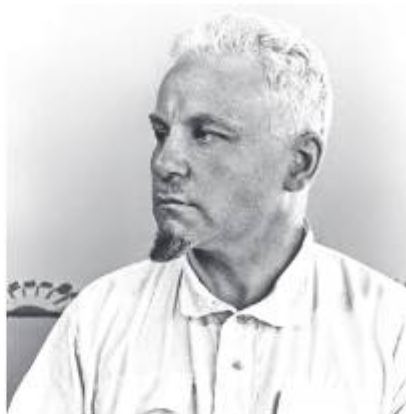
Артур Христианович Артузов (1891–1937) — деятель советских органов государственной безопасности. Один из основателей советской разведки и контрразведки, корпусной комиссар (1935)

В 1934 году в СССР существовало четыре самостоятельные разведывательные службы. Это Иностранный отдел НКВД, Раз-