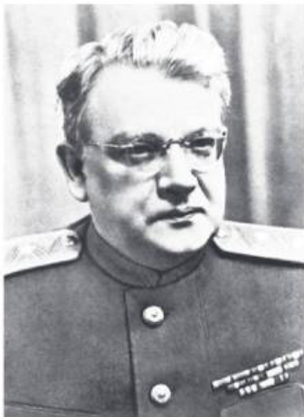
Федотов Пётр Васильевич (1901–1963) — деятель советских спецслужб, генерал-лейтенант (1945). С 26 февраля 1941 г. — начальник 2-го управления НКГБ, с 31 июля 1941 г. — НКВД, а с 12 мая 1943 г. — опять НКГБ (затем МГБ) СССР.

Надо сказать, что Райхман в 1946–1951 годах продолжал руководить контрразведывательной работой, став первым заместителем Е. Питовранова, начальника контрразведывательного управления с 1946 года, а позднее заместителя министра госбезопасности. Фактически всю эту работу инициативно направлял Райхман вплоть до своего ареста в октябре 1951 года. Он был незаурядным, очень хорошо знающим агентурную работу человеком, совершенно искренне считавшим свою деятельность специальным направлением партийной работы. Райхман сам провел ряд важных агентурных комбинаций, в его распоряжении был мощный аппарат.