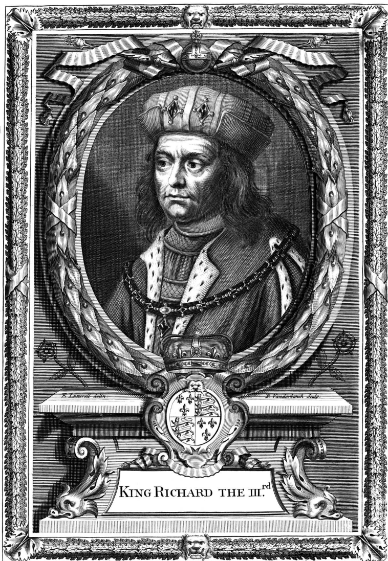
Портрет Ричарда Третьего (конец XVII века)