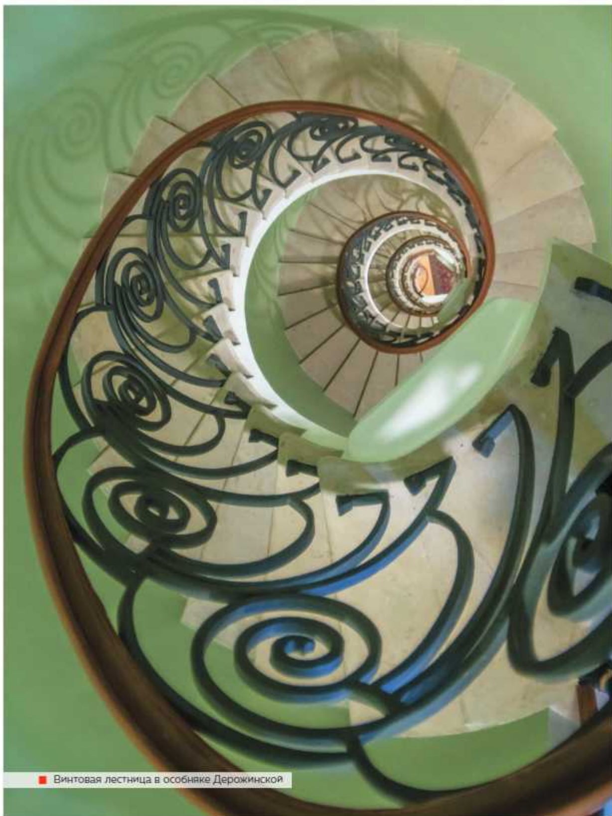
■ Винтовая лестница в особняке Дерожинской