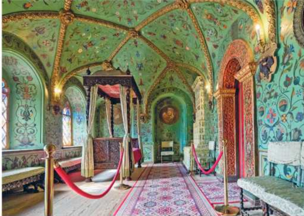
■ Палата Теремного дворца