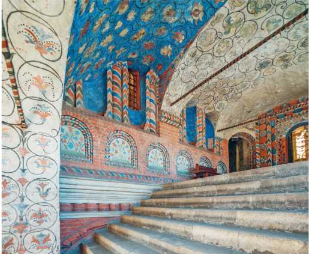
■ Росписи в Соборе Василия Блаженного

В XIV веке во время правления Ивана Калиты началось укрепление Московского княжества. Москва стала расти и строиться. Сооружались дворцы, церкви и палаты. Приняв великокняжескую власть, а также кафедру митрополита из Владимира, Москва переняла и владими́ро-суздальскую домонгольскую архитектурную традицию. Московские зодчие переосмысливали Владимиро-Суздальскую школу и добавляли свои детали. Так появилась раннемосковская архитектура XV—XVI веков.