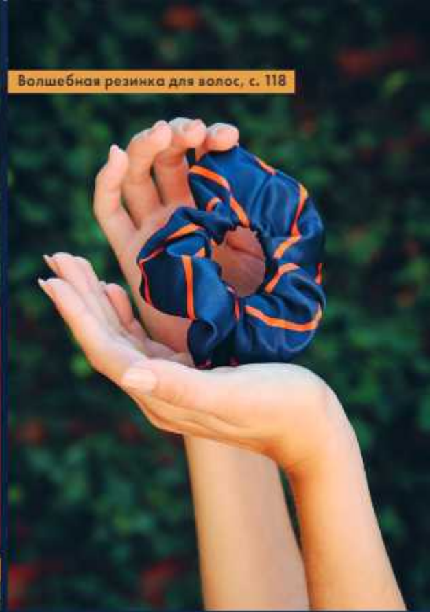
Волшебная резинка для волос, с. 118