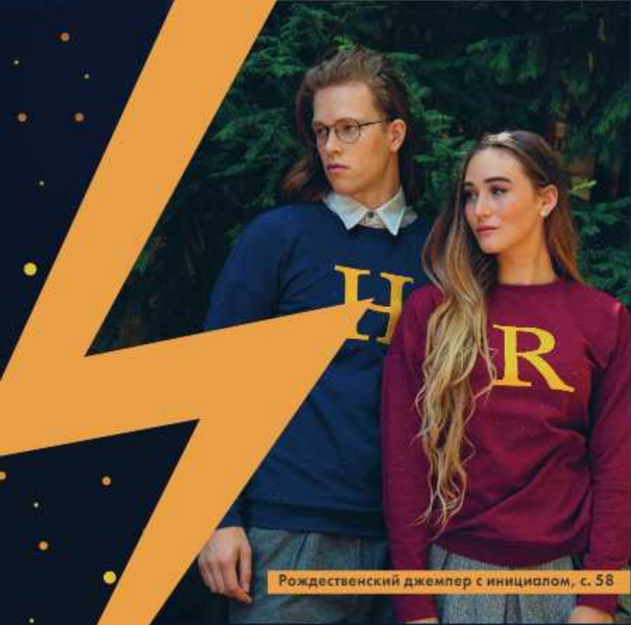
Рождественский джемпер с инициалом, с. 58