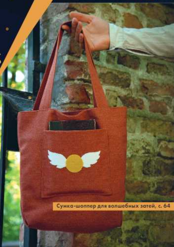
Сумка-шоппер для волшебных затей, с. 64