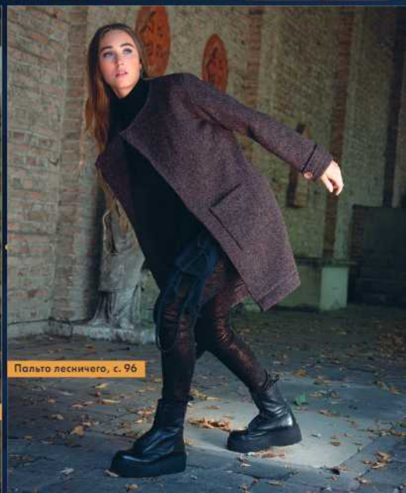
Пальто лесничего, с. 96