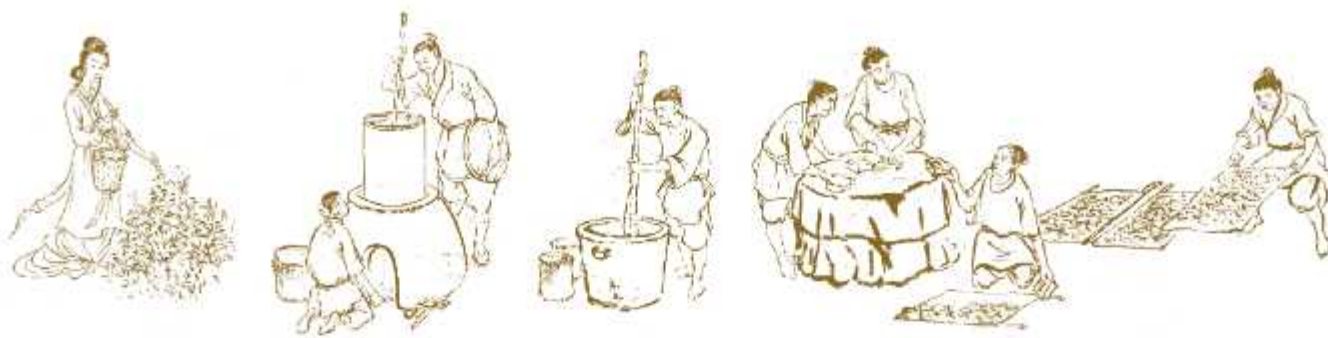
Иллюстрации из «Чайного канона»

Танский государь Дай-цзун пытался назначить Лу Юя настоятелем монастыря Тайшансы или учителем литературы наследного принца. Но в обоих случаях Лу Юй не явился на службу. Не ценил он ни власть, ни знатность, не уделял внимания богатству, любил природу и твердо придерживался справедливости.