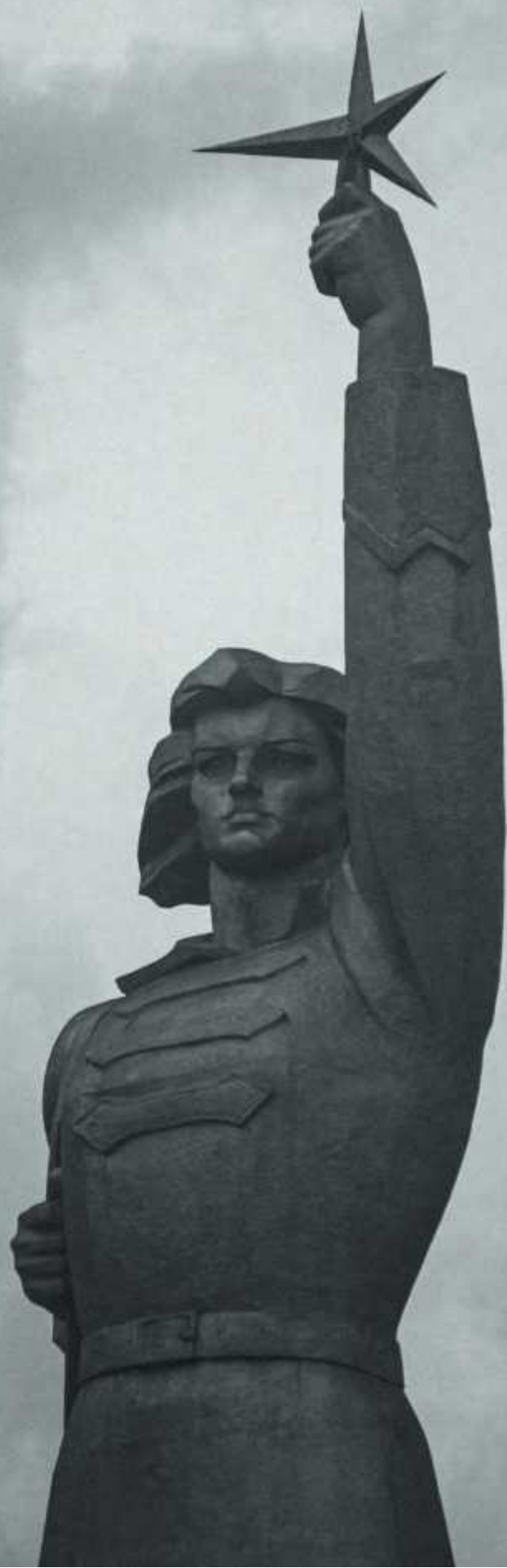
«Аврора» Авторы: Е. Сердюков, И. Шмагун, Е. Лашук, 1967 Краснодар, Россия