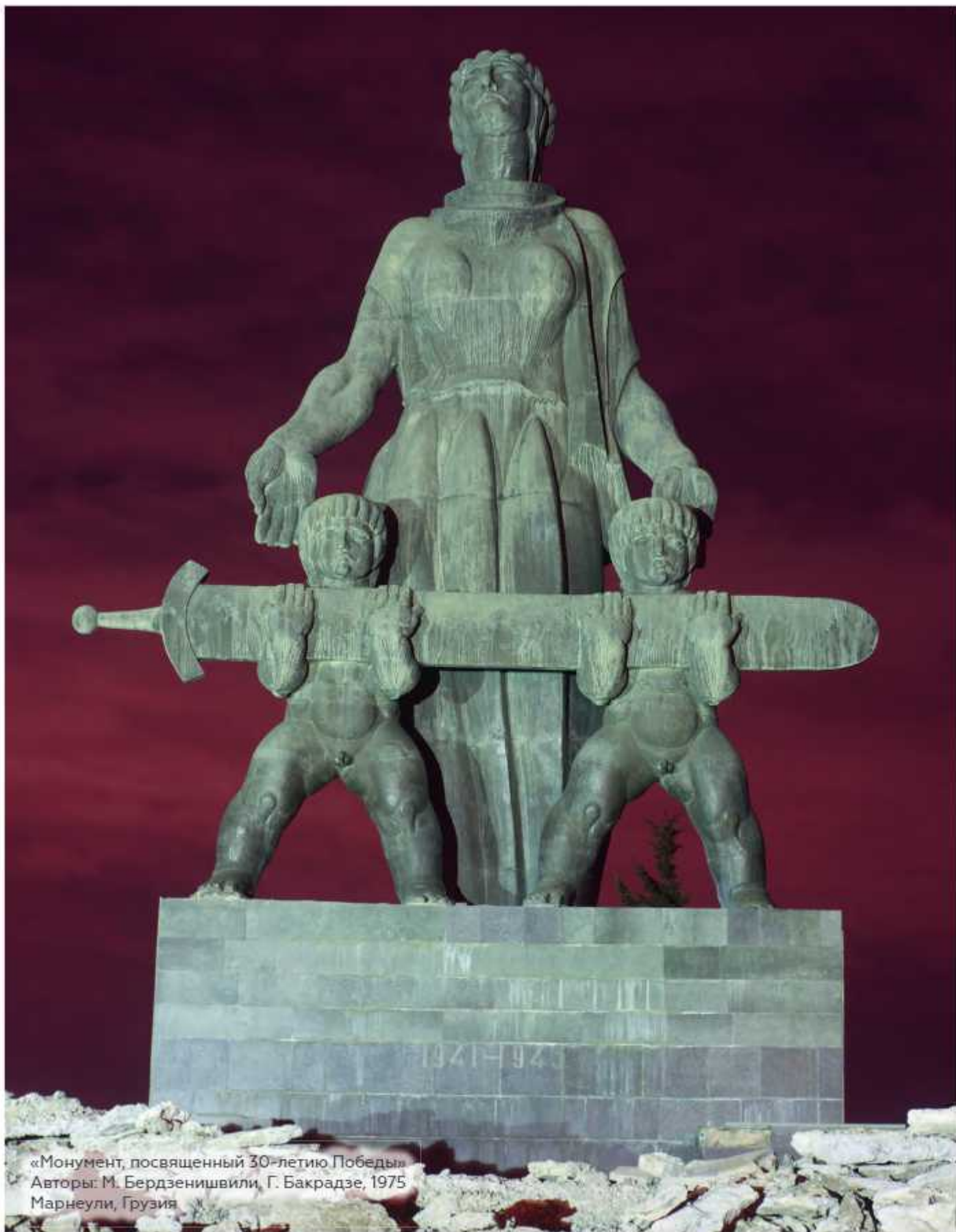
«Монумент, посвященный 30-летию Победы» Авторы: М. Бердзенишвили, Г. Бакрадзе, 1975 Марнеули, Грузия