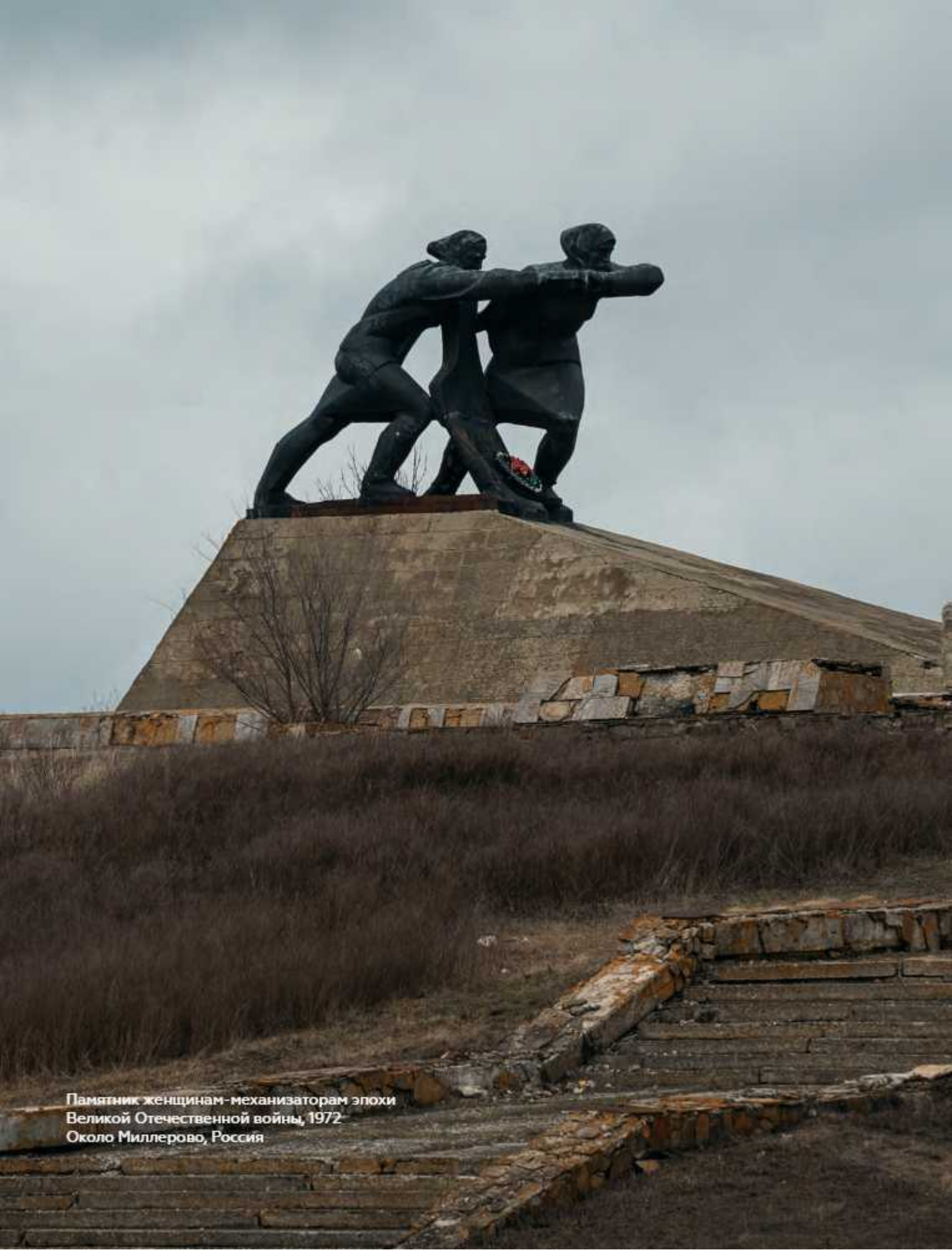
Памятник женщинам-механизаторам эпохи Великой Отечественной войны, 1972 Около Миллерово, Россия