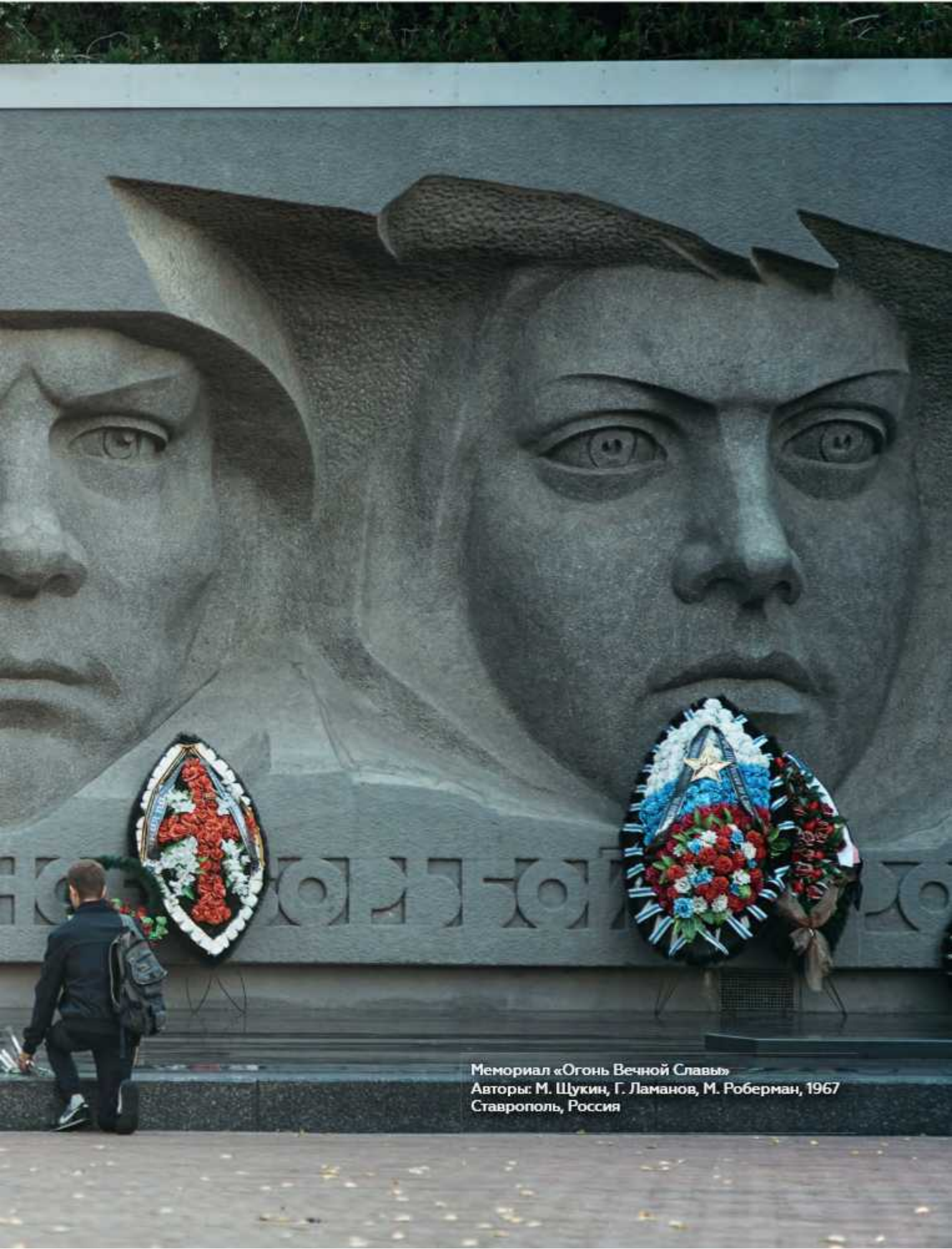
Мемориал «Огонь Вечной Славы» Авторы: М. Шукин, Г. Ламанов, М. Роберман, 1967 Ставрополь, Россия