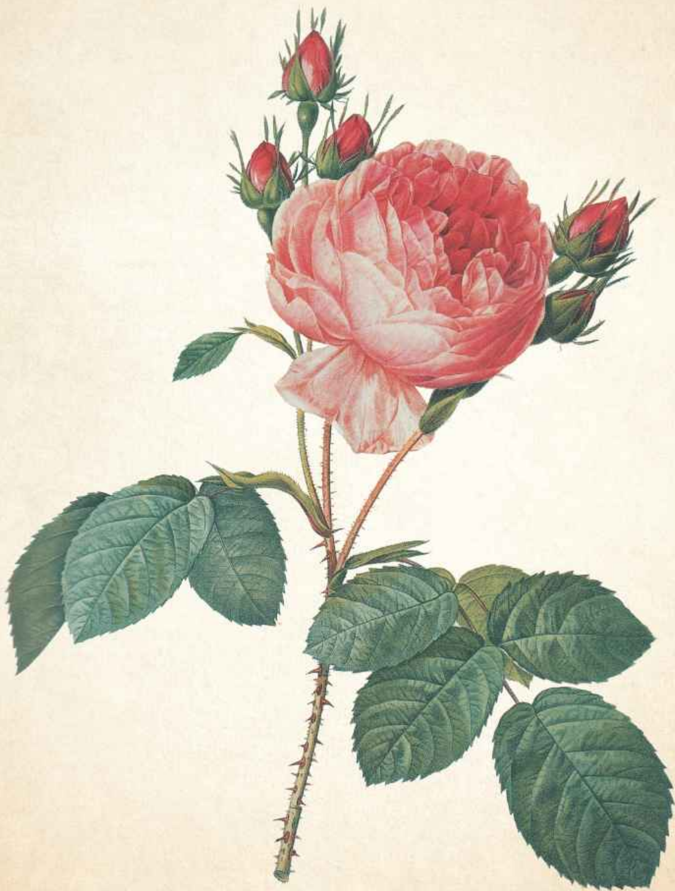
Rosa centifolia L. «Major»