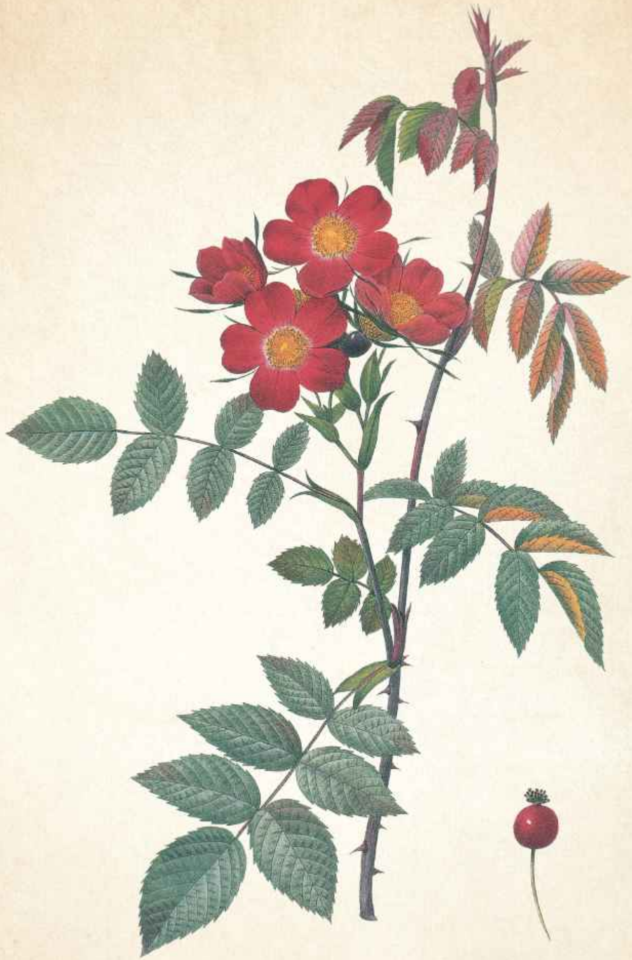
Rosa glauca Pourret