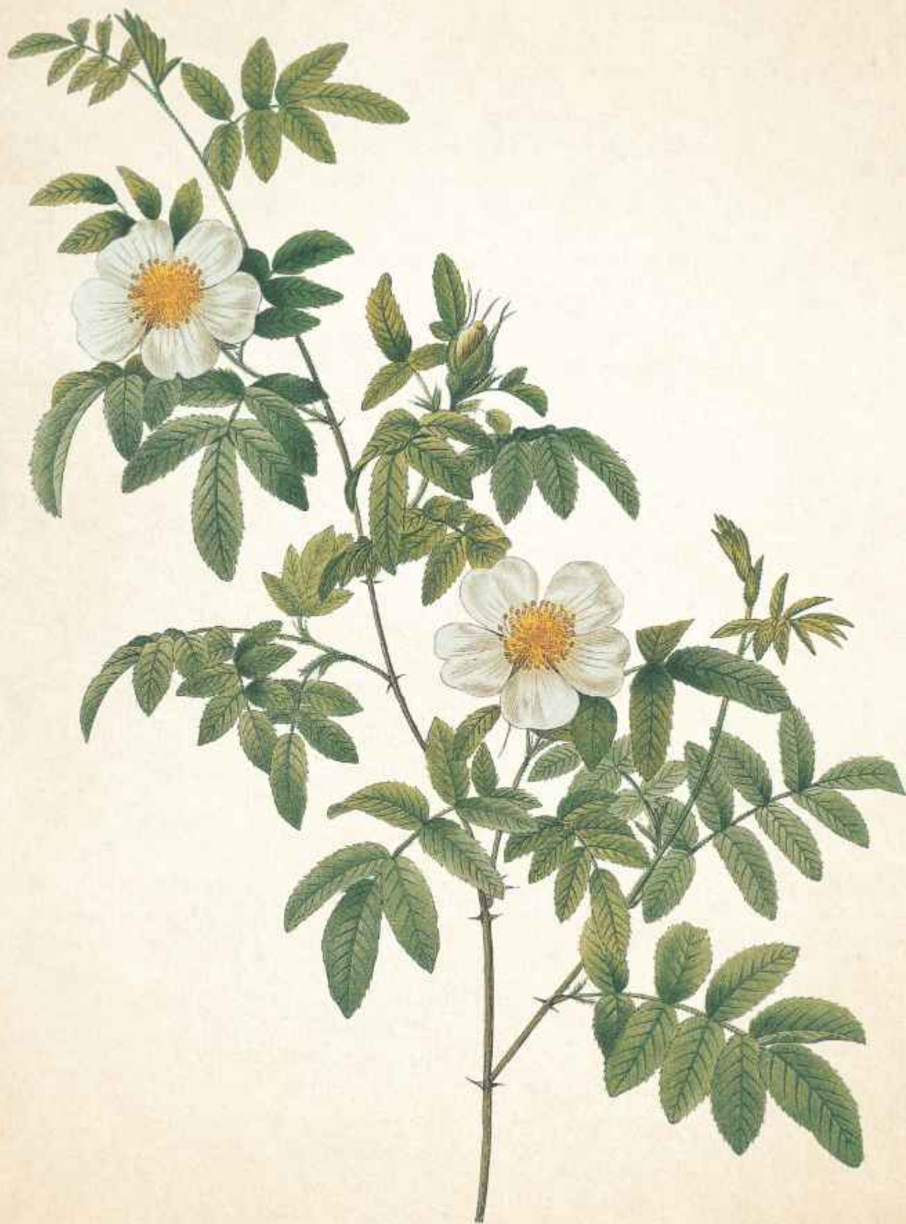
Rosa clinophylla Thory