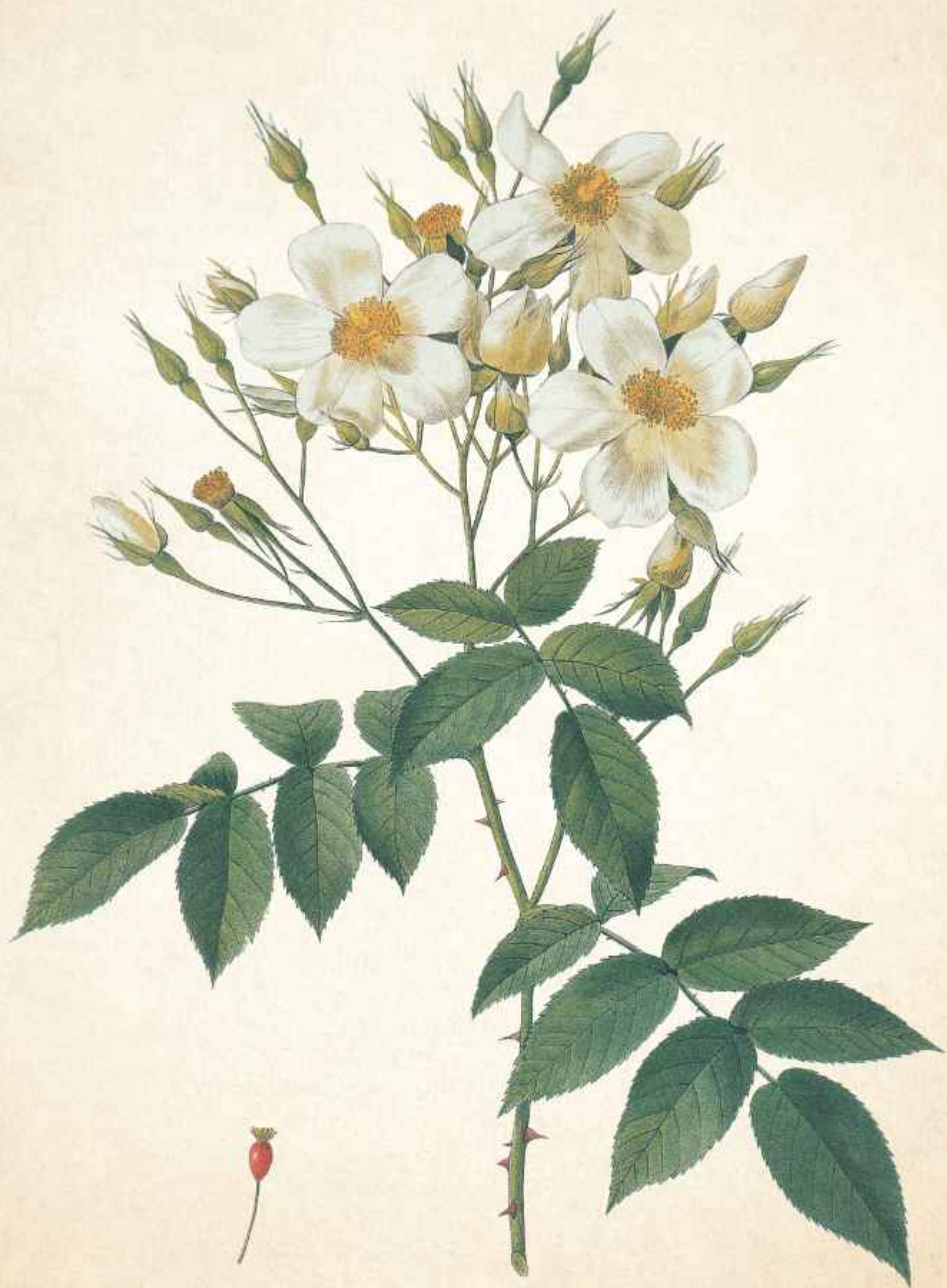
Rosa moschata Herrm.