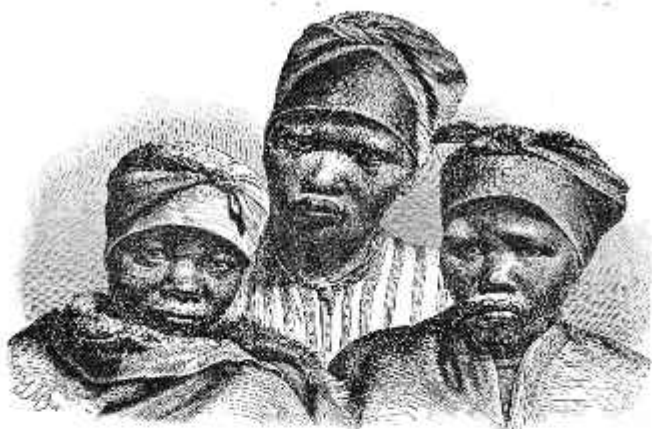
Готтентотки племени номаков

лицо, проводя красной краской круги вокруг глаз и дугообразные линии на лбу и щеках. Только одну свою старинную обувь готтентоты сохранили и до сих пор, они носят сандалии из коры или кожи, в таких сандалиях нога не тонет в сыпучем песке.