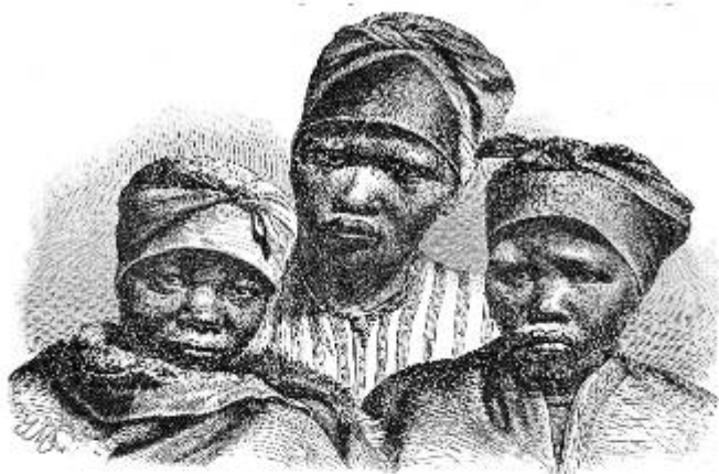
Готтентотки племени номаков

лицо, проводя красной краской круги вокруг глаз и дугообразные линии на лбу и щеках. Только одну свою старинную обувь готтентоты сохранили и до сих пор, они носят сандалии из коры или кожи, в таких сандалиях нога не тонет в сыпучем песке.