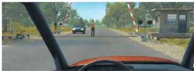
Регулировщик на железнодорожном переезде

«Средство индивидуальной мобильности» — транспортное средство, имеющее одно или несколько колес (роликов), предназначенное для индивидуального передвижения человека посредством использования двигателя (двигателей) (электросамокаты, электроскейтборды, гироскутеры, сигвеи, моноколеса и иные аналогичные средства).