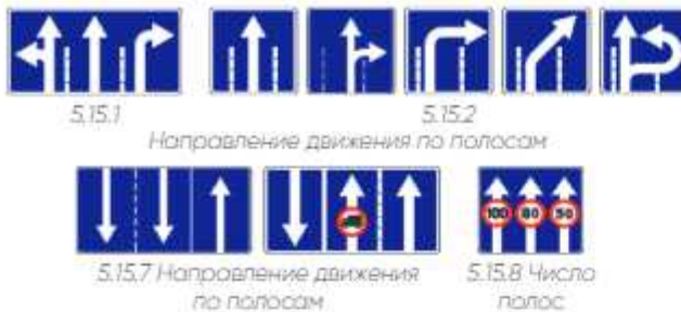
5.15.1 5.15.2 Направление движения по полосам