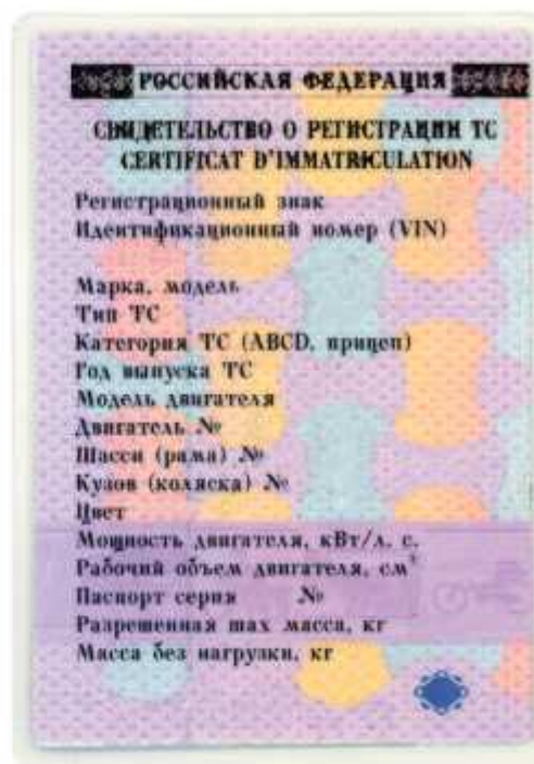
Свидетельство о регистрации ТС

абзац исключен. — Постановление Правительства РФ от 12.11.2012 № 1156;