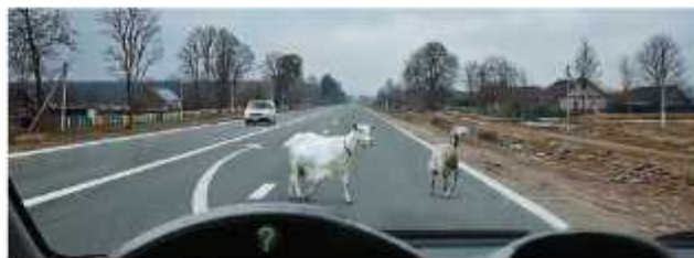
Препятствие на дороге может встретиться в любом проявлении. Однако животное на дороге — не просто препятствие, поскольку поведение животного может быть непредсказуемым. Постарайтесь животное не напугать, так как в стрессе животное может стать причиной ДТП.

Не является препятствием затор или транспортное средство, остановившееся на этой полосе движения в соответствии с требованиями Правил.