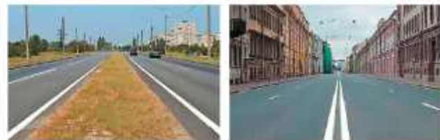
Транспортные потоки противоположных направлений разделены разметкой 1.3