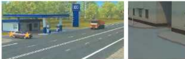
Примеры выезда с прилегающей территории (выезд с АЗС, выезд со двора)

«Прилегающая территория» — территория, непосредственно прилегающая к дороге и не предназначенная для сквозного движения транспортных средств (дворы, жилые массивы, автостоянки, АЗС, предприятия и тому подобное). Движение по прилегающей территории осуществляется в соответствии с настоящими Правилами.