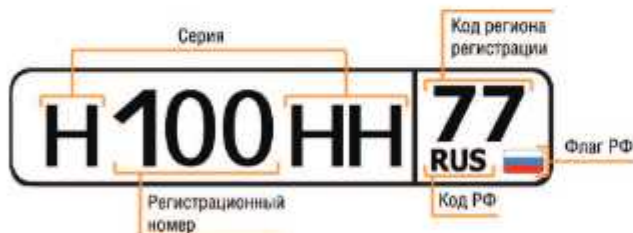
Структура регистрационного знака ТС

иметь на данном транспортном средстве (при наличии прицепа — и на прицепе) регистрационные и отличительные знаки государства, в котором оно зарегистрировано. Отличительные знаки государства могут помещаться на регистрационных знаках.