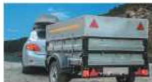
Прицеп к легковому ТС