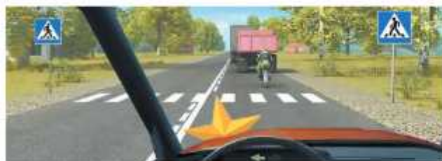
Комплекс установки 5.19.1, 5.19.2 и разметки 1.14.1 указывают на расположение пешеходного перехода