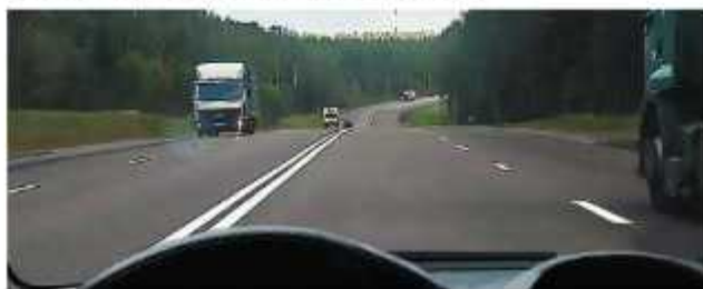
Правостороннее движение ТС

1.4. На дорогах установлено правостороннее движение транспортных средств.