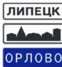
5.23.1, 5.23.2, 5.25

Знак 5.25 «Начало населенного пункта» (на синем фоне) устанавливается перед началом небольшого населенного пункта или на окружной дороге крупного населенного пункта, где для безопасности движения целесообразно вводить требования соблюдения Правил для движения в населенных пунктах.