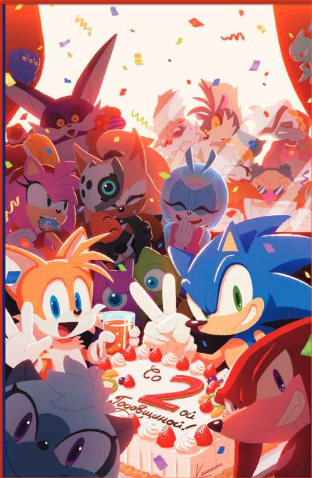
РИСУНОК - ЮИ КАРАСУНО ИЗ SONIC TEAM