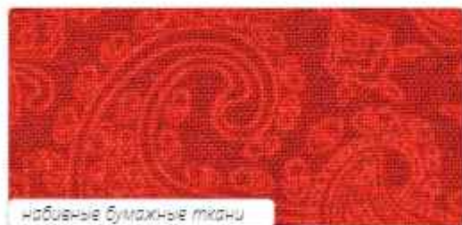
набивные бумажные ткани