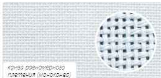
канва равномерного плетения (моноканва)