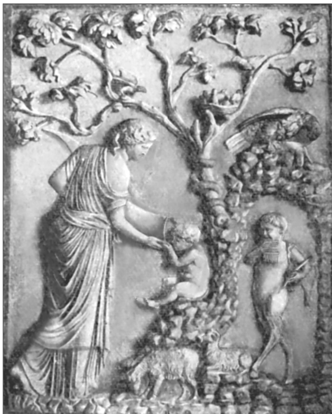
Нимфа Адрастея кормит маленького Зевса из рога козы Амалфеи. Сзади Зевса стоит маленький бог Пан, играющий на свирели. (Барельеф II в. до н. э.)

Рея не хотела потерять и последнего своего ребёнка. По совету своих родителей, Урана (Неба) и Геи (Земли), удалилась она на остров Крит, и там, в глубокой пещере, родился у неё младший сын, Зевс. В этой пещере Рея скрыла своего сына от жестокого отца, а ему дала проглотить вместо сына длинный камень, завёрнутый в пелёнки.