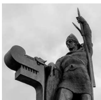
Статуя викинга Ингольфура Арнарсона, семья которого поселилась в Исландии в 874 году. Рейкьявик, Исландия

Чем суровее условия жизни, чем больше усилий должен прилагать человек для выживания, тем драматичнее сказания. Это в полной мере касается скандинавских саг — части германо-скандинавской мифологии. Предки современных