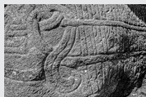
Рунный камень Харальда в Дании

Для наглядности возьмем одну сюжетную основу — божественная власть нисходит с небес на землю — и посмотрим, как она реализуется в различных мифологических системах. В древнегреческой мифологии сын богини дневного света Гемеры Уран, олицетворяющий небо, сочетался браком с Геей — Землей, породив множество дивных существ. Громовержец Зевс — царь богов, внук Урана и Геи — взирал на людей с неприступной вершины Олимпа. Среди детей, родившихся от союза Зевса со смертными женщинами, не только герои, но и цари. Самая известная и почитаемая богиня японского пантеона, Аматаэрасу, — олицетворение солнца, праматерь императоров. В германо-скандинавской мифологической традиции верховным божеством является Один (Водан, Водан), мудрец и бог войны (в греческом пантеоне таким сочетанием функций могла похвастаться Афина). Среди его сыновей Тор — опять же бог-громовержец (как тут не вспомнить еще и славянского Перуна!); Ингви, считавшийся родоначальником династии королей