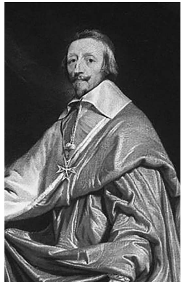
Слева — патриарх Иоаким Московский (1621—1690), икона работы неизвестного художника XVII в., справа — французский кардинал Ришелье (1585—1642), портрет работы Филиппа де Шампenea, XVII в.