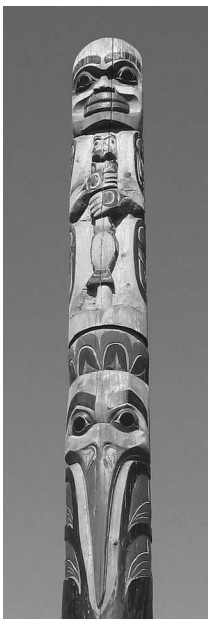
Тотемное изображение в Виктории (Канада)

Человек устроен так, что все пытается понять и познать. Окруженный необъяснимым, он подобен ребенку в темной комнате: а вдруг совсем рядом притаилась неведомая опасность, и никто не придет на помощь? То важное для нас, что бессилён постичь разум, издревле объясняет вера.