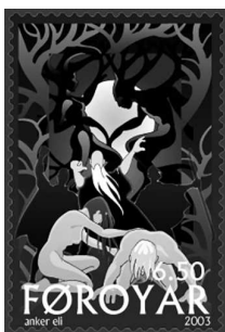
Аск и Эмбла на почтовой марке Фарерских островов

Едва начав осознавать свое «я» и отделять себя от природы, человек заметил, что мир устроен удивительно разумно. Ночь сменяется днем, ясная погода — дождливой; потрудившись, можно добыть себе пропитание и одежду, обустроить жилище. Почему всё так, а не иначе? Чьему замыслу и воле человек обязан самим своим существованием?