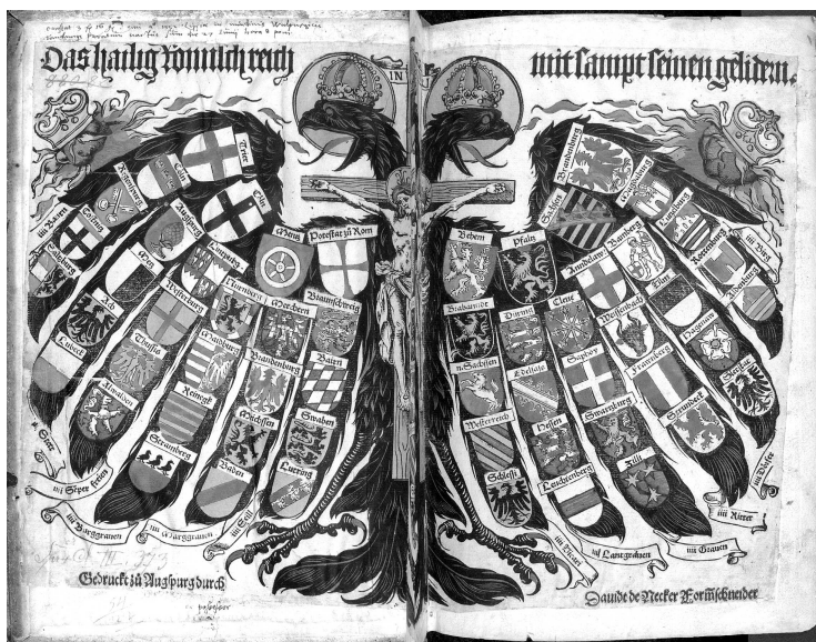
Двуглавый орел, олицетворяющий Священную Римскую империю, с гербами входящих в империю государств. Гравюра XV века

германскими державами. Если же смотреть глубоко в этнические корни, особенно так, как впоследствии это делало руководство Третьего рейха, то касаясь германского начала двух величайших германских государств могут возникнуть вопросы.