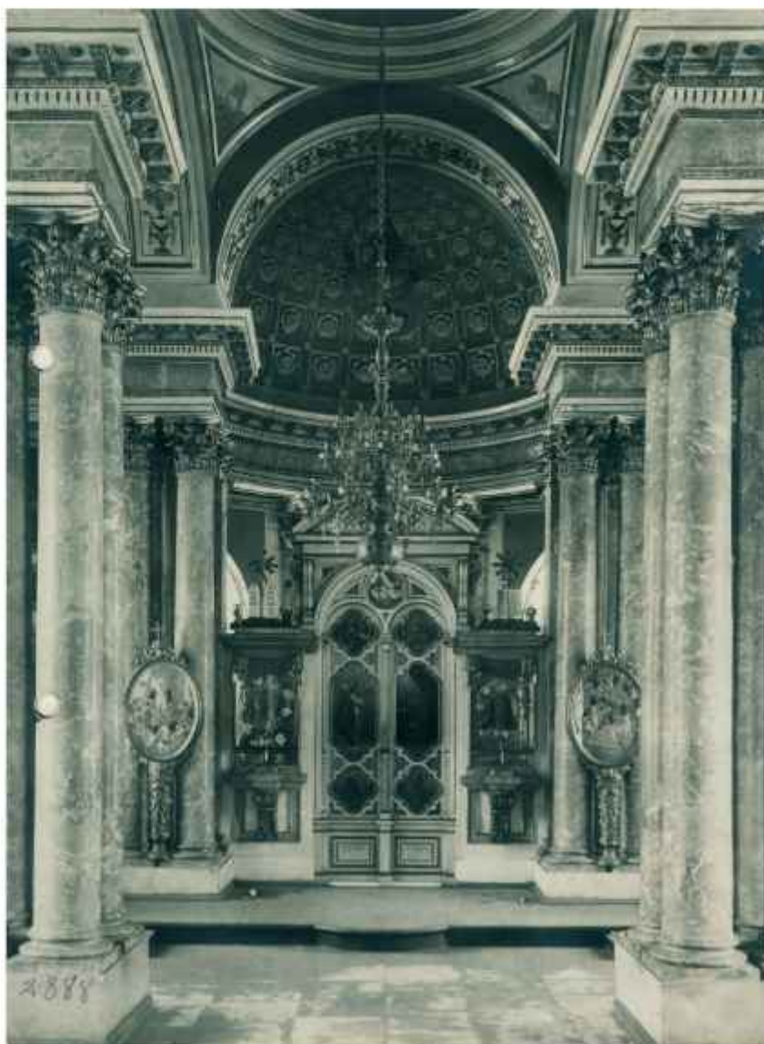
Фото справа: Владимирская церковь. Вид на главный иконостас.