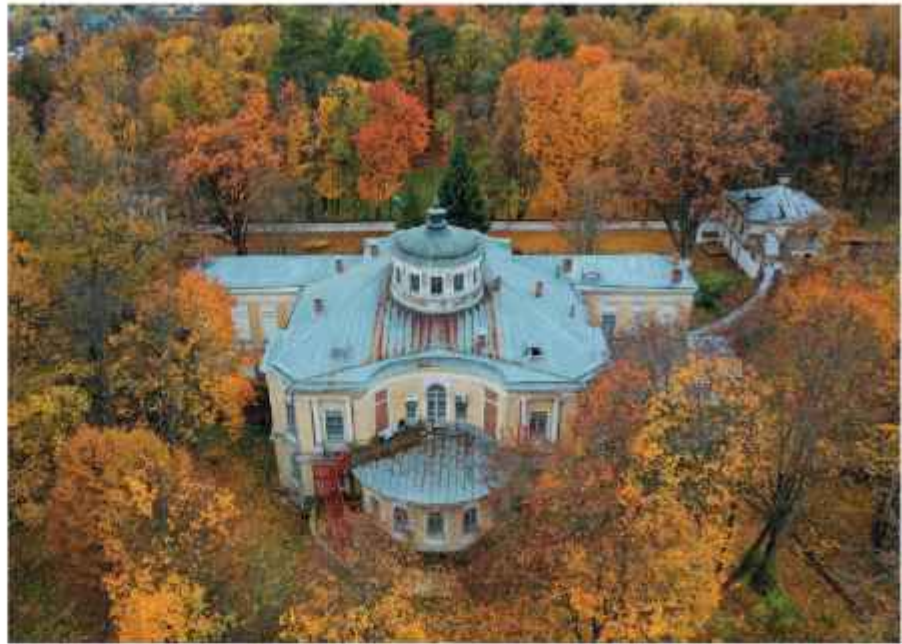
Фото слева: Главный дом усадьбы Васильевское Щербатовых