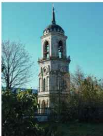
Фото справа: Центральная часть паркового фасада господского дома.

тору, обосновавшемуся в России, Бернхарду Симону 1 (Бернар де Симон) обновить довольно запущенное имение, что в 30 верстах от Москвы. Швейцарец заменил старый барский дом ренессансным «замком» с башней.