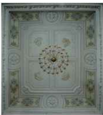
Роспись плафона «Четыре времени сна» в парадной спальне графини