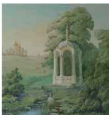
Живопись XIX в. на восточной (павильон Эрмитаж) и западной стене (Часовня над святым источником) в кабинете графа