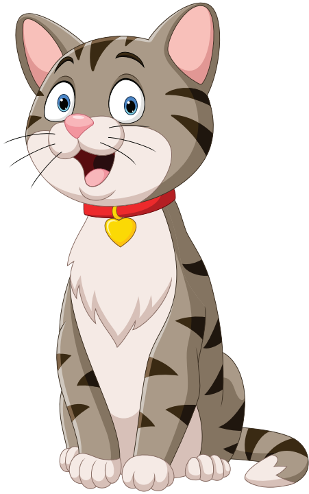
Кот мяукает: Мяу-мяу