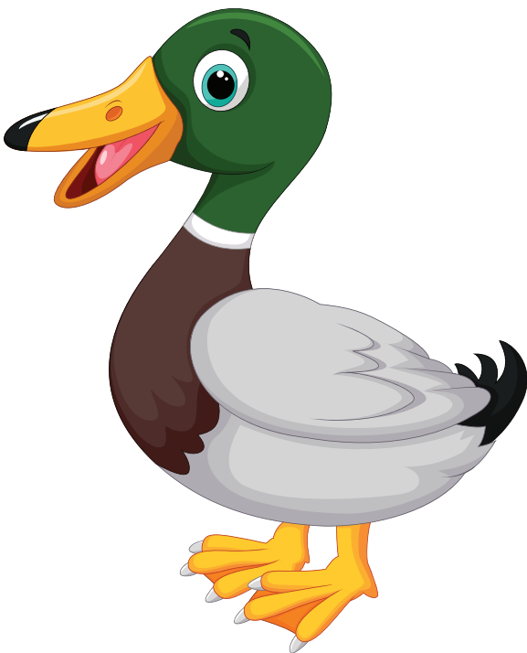
Утка крикает: Кря-кря