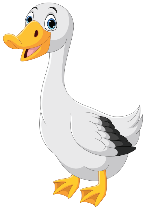
Гусь гогочет: Га-га-га