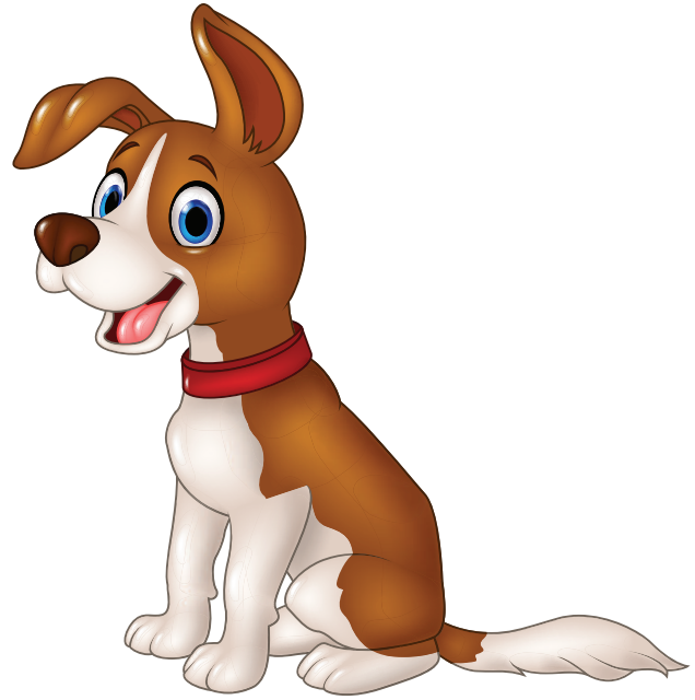
Собака лает: Гав-гав