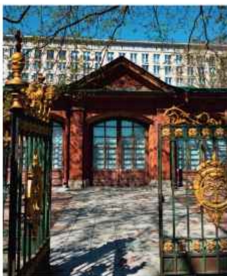
▲ Домик Петра I неподалеку от Троицкой площади

Домик Петра сохранился до наших дней и сейчас представляет собой музей. Для лучшей сохранности избушку накрыли каменным «футляром».