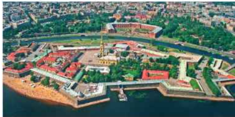
▲ Вид на Петропавловскую крепость с высоты. Хорошо видны бастионы. Полоса берега была «досыпана» позже, первоначально стены вырастали практически прямо из воды

Постепенно крепость стали называть Петропавловской (по названию церкви, которая тогда еще не превратилась в огромный собор с позолоченным шпилем), а Санкт-Петербургом начали именовать город, строившийся под ее защитой.