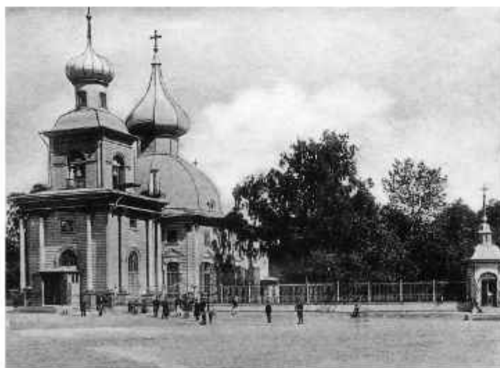
▲ Церковь Святой Троицы (Троицкий собор) на фото 1890-х годов

Известно, что Петр, если был в Петербурге, часто присутствовал на богослужениях в Троицком соборе и даже пел на клиросе. Более того, он изготовил для храма светильник-паникадило из бронзы и слоновой кости, а также коробочки для ладана. Храм особо отличали многие наши правители: например, императрица Елизавета для него собственноручно вышила на престольную сень.