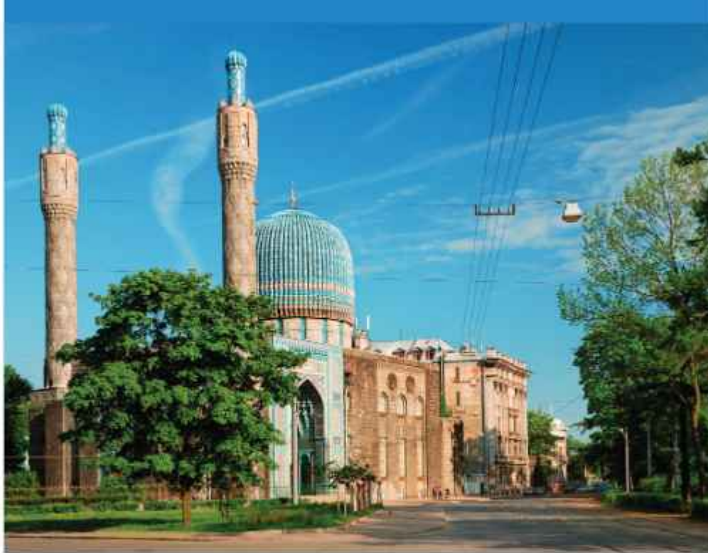
▲ Петербургская соборная мечеть, находящаяся неподалеку от Троицкой площади