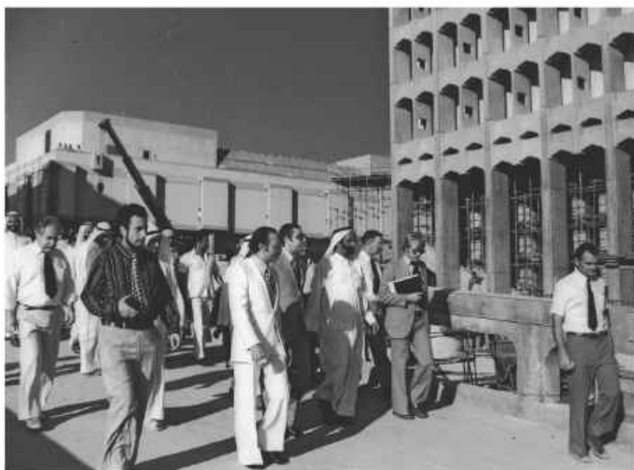
Рис. П. 4

Эксперты и советники сопровождают шейха Рашида бин Саида аль-Мактума (на фото в центре) во время визита на стройплощадку Всемирного торгового центра в Дубае. Около 1978 г.