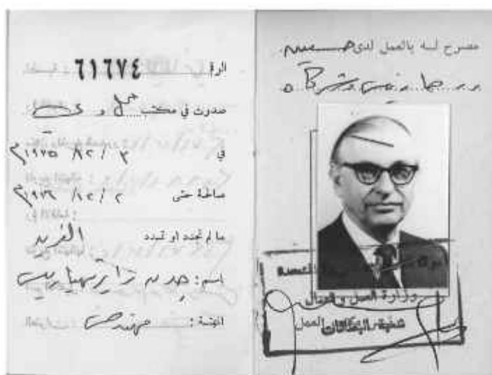
Рис. П. 3

Разрешение на работу в Дубае на имя Джона Харриса