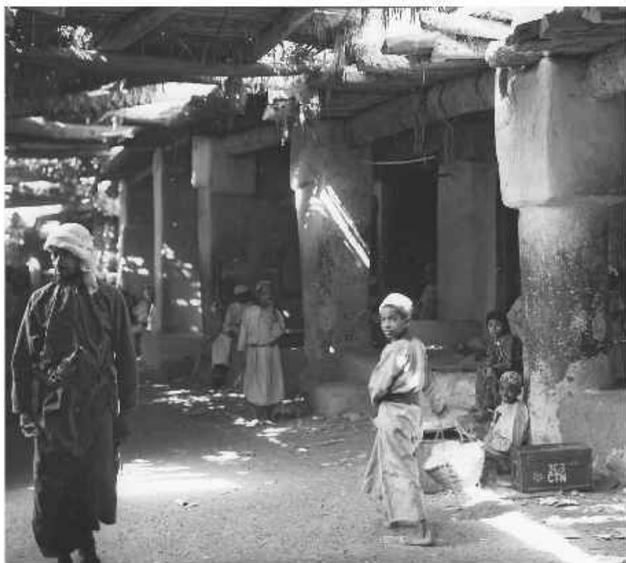
Рис. П. 2

Хозяева дубайского порта — арабские, южноазиатские и иранские торговцы — жили своей жизнью. Они пользовались некомпетентностью британских наблюдателей, поддерживая миф о порте, как реликте XIX в. На самом же деле торговцы Дубая мыслили вполне современно и тайно поддерживали обширные внешние связи. К неудовольствию англичан, город постепенно становился региональным центром торговли оружием и другими товарами. В город прибывала современная техника, а также новости и прочие веяния со всего мира. Коммерсанты слышали о политических переменах, происходивших поблизости, и о том, как за пределами Дубая приходит конец эпохе колониализма.