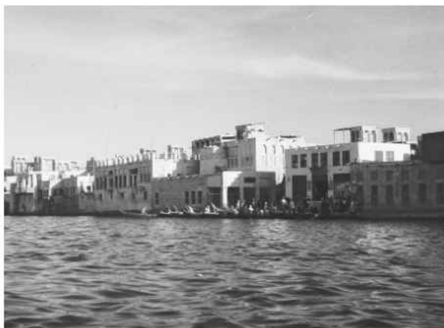
Рис. П. 1

Вид на Хор-Дубай с борта абры (небольшой лодки). Ноябрь 1959 г.