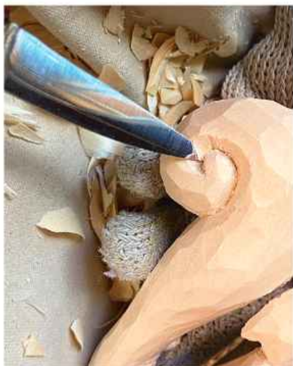
Классический резчицкий нож с лезвием длиной 2,5–3,8 см хорошо подойдет для проектов, описанных в этой книге.

и размеров, а также из разных материалов. Но здесь наиболее важно то, как инструмент ложится в руку и как ощущается в ней. Нож в буквальном смысле является продолжением вашей руки, и, если его неудобно держать и у вас нет полного контроля над ним, вы создаете себе неудобство еще до того, как начнете резьбу.