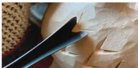
Угловая стамеска или стамеска-уголок