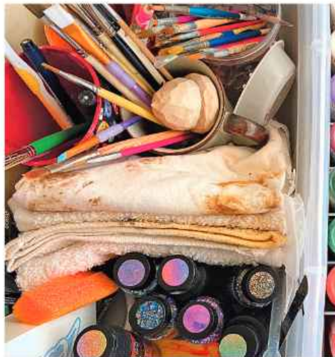
Я использую акриловые краски из местного магазина для рукоделия.