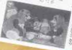
高畑勲監督の代表作「平成狸合戦ぽんぽこ」の監督。高畑勲監督は、この作品で、日本のアニメーションの歴史を、またひとつ、大きく進歩させた。

高畑勲監督の代表作として知られる「平成狸合戦ぽんぽこ」は、日本のアニメーション界に、いかにアニメーションの面白さを追求したかがよくわかる。高畑勲監督は、この作品で、日本のアニメーションの歴史を、またひとつ、大きく進歩させた。