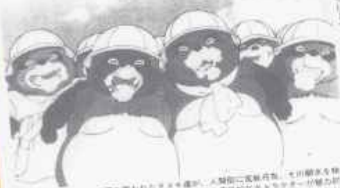
平成狸合戦ぽんぽこ。高畑勲監督の代表作。大塚和彦監督の「平成狸合戦ぽんぽこ」が、いかにアニメーションの面白さを追求したかがよくわかる。高畑勲監督は、この作品で、日本のアニメーションの歴史を、またひとつ、大きく進歩させた。

高畑勲監督の代表作として知られる「平成狸合戦ぽんぽこ」は、日本のアニメーション界に、いかにアニメーションの面白さを追求したかがよくわかる。高畑勲監督は、この作品で、日本のアニメーションの歴史を、またひとつ、大きく進歩させた。