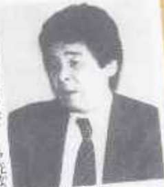
高畑勲監督の代表作「平成狸合戦ぽんぽこ」の監督。高畑勲監督は、この作品で、日本のアニメーションの歴史を、またひとつ、大きく進歩させた。

高畑勲監督の代表作として知られる「平成狸合戦ぽんぽこ」は、日本のアニメーション界に、いかにアニメーションの面白さを追求したかがよくわかる。高畑勲監督は、この作品で、日本のアニメーションの歴史を、またひとつ、大きく進歩させた。