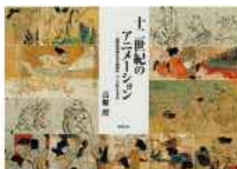
Анимация в XII веке

Исследование свитков с японскими картинами XII века, опубликованное Tokuma shoten