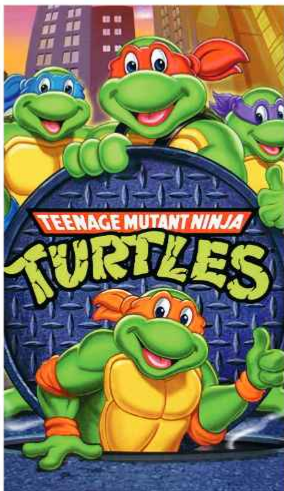
Черепашки-ниндзя © Fred Wolf Films. Все права защищены.