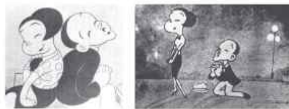
«В мире власти и страсти», 1933

Первым анимационным фильмом, который посмотрел Исао Такаката в 1943 году, стал «Паук и трюлпан» Кэнзю Масасоки. Будучи одним из первых аниматоров в истории Японии, последний произвел революцию в этой области. Он родился в семье среднего класса в Осаке в 1898 году и, прежде чем начать работать в анимации в 1932 году, изучал искусство, включая западную