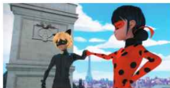
Леди Баг и Супер-кот

полнометражный фильм «Легенда о белой змее» в 1938 году. Именно эта похожая на диснеевскую адаптация китайской легенды подтолкнула Хаяо Миязаки к желанию создавать анимацию и открыла для студии двери на международный рынок, выйдя в 1961 году в США, несмотря на свой небольшой успех. С тех пор Тоёи Animation разрабатывала как собственные проекты (телесериалы, фильмы, адаптации видеоигр), так и фильмы по заказу анимационных студий в США (несколько мультфильмов Marvel, включая «Люди Икс: Прайда Людей Икс» и первый сериал «Черепашки-мутанты-ниндзя»), Франции («Леди Баг и Супер-кот») и Японии — сейчас студия является ключевым игроком в японской анимации. Ее работы послужили своеобразной школой и обязательным пунктом обучения для многих японских аниматоров и режиссеров, которые впоследствии основали свои собственные анима-