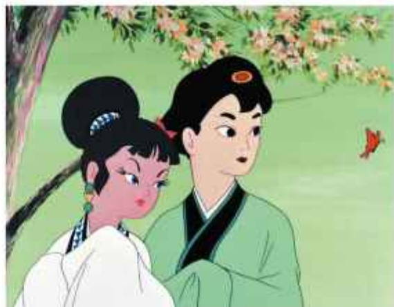
«Акико в белой юбке»