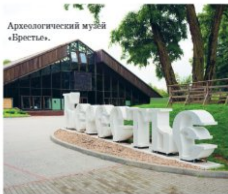
Археологический музей «Берестье».

В его основу легли подлинные остатки древнего городища, обнаруженные в ходе археологических раскопок. Именно здесь, на Вольнском укреплении, много столетий назад зародился древний город. Археологи нашли порядка тридцати хорошо сохранившихся деревянных построек XI–XIII вв., среди которых есть срубы жилых домов, хозяйственных построек, фрагменты мостовых и ограждений, а также различные предметы быта. Единственное место, где деревянные жилища сохранились на высоту до 12 венцов. Здесь же, как полагают ученые, находится самое первое