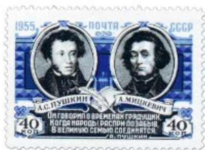
Александр Пушкин и Адам Мицкевич на советской почтовой марке.

инство (дворянство). Особняки построены в 1830–40 гг. и являются одними из самых старых зданий в городе.