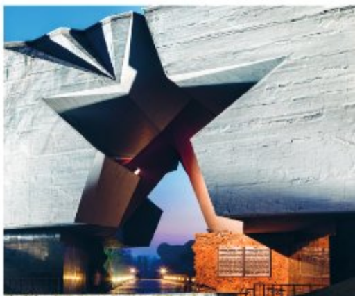
Главный вход на территорию Брестской крепости.

Армейский клуб является одним из уникальных фортификационных объектов Брестской крепости, располагается в пороховом погребе № 1, что в юго-восточной части Кобринского укрепления. Накану-