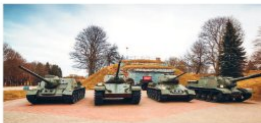
Экспозиция военной техники перед Армейским клубом.