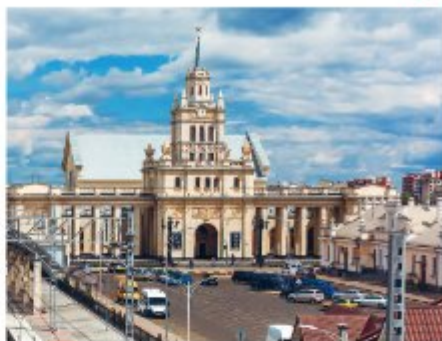
Железнодорожный вокзал Бреста.

Город разделен на две части рекой Мухавец (через реку переброшены четыре автодорожных и два железнодорожных моста). К северу от реки находятся кварталы исторического центра (застроеного домами конца XIX – начала XX в.), обширные кварталы частного сектора, микрорайон Восток, районы заводской застройки. К югу от Мухавца активно развиваются новые районы массовой застройки Ковалево, Вулька. Главная улица города – проспект Машерова (переходит в улицу Московскую). Основная пешеходная улица Бреста – улица Советская, прорезающая центр города и пересекаемая бульварами. В архитектуре Бреста сохранились здания, возведенные в разных стилях, например, классицизм, романтизм, эклектика, модерн, конструктивизм, сталинский ампи́р.