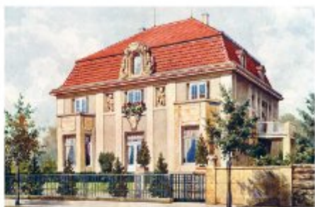
Большинство домов на ул. Леваневского остались еще с польских времен.

Продвигаясь по улице Леваневского в западном направлении, попадем в Парк культуры и отдыха (Ленина ул., 3) – са-