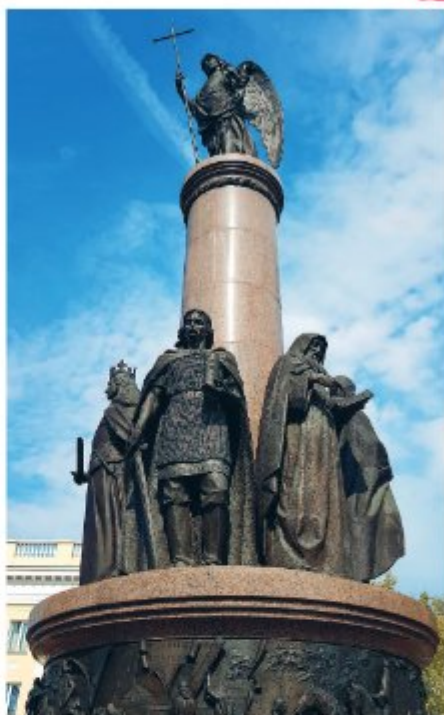
Памятник 1000-летия Бреста, скульптор А. Павлючук и архитектор А. Андреев.

(Советская ул., 34). По легенде, всем примерявшим этот сапог и нащупавшим во время примерки в нем монеты сулят богатство! Говорят, что второй сапог из пары спрятан во Львове и хранит намного больше богатства.