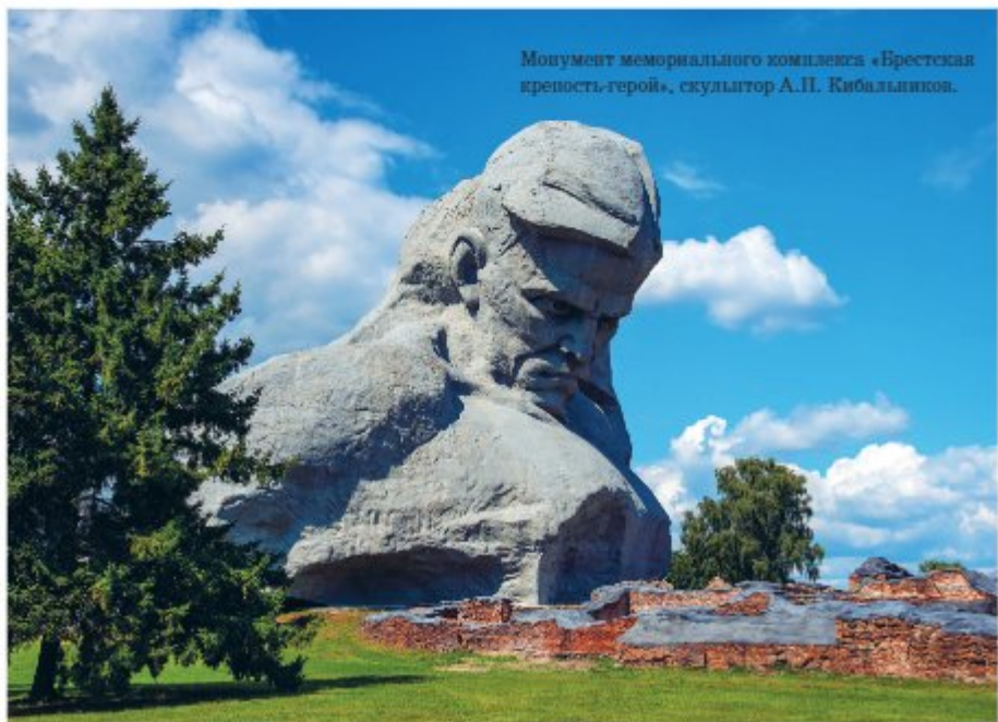
Монумент мемориального комплекса «Брестская крепость-герой», скульптор А. П. Кивальников.