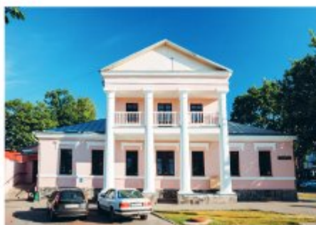
Особняк помещика Ягмина, Мицкевича ул., 22.

ские львы и любители женщин, оба были в ссылке по политическим мотивам. Они познакомились в Москве в 1826 г., встречались в одних салонах и с удовольствием проводили время вместе.