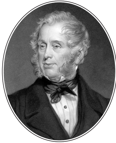
Премьер-министр Великобритании Генри Джон Темпл, 3-й виконт Пальмерстон (1784–1865)

целостности Турции, союзники напали на Одессу, Севастополь, Свеаборг и Кронштадт, на Колу, Соловки, на Петропавловск-на-Камчатке, а турки вторглись в Грузию. Британский кабинет уже строил и подробно разрабатывал планы отторжения от России Крыма, Бессарабии, Кавказа, Финляндии, Польши, Литвы, Эстонии, Курляндии, Лифляндии. Вдохновитель всех этих планов, «воевода Пальмерстон», иронически воспетый в русской песенке, «в воинственном азарте... поражает Русь на карте указательным перстом», а его французские союзники уже начинают сильно беспокоиться, наблюдая рост аппетита увлекающегося милорда.