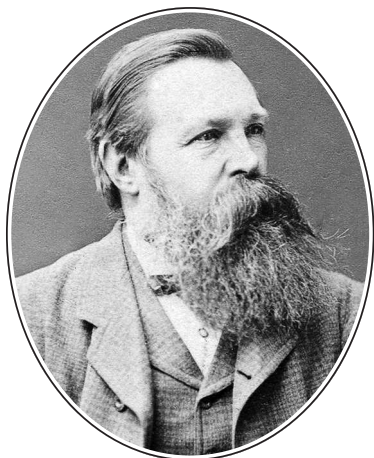
Фридрих Энгельс (1820–1895)

Революционер Барбес восторженно писал из тюрьмы о войне Франции против северного деспота. Его письмо, перехваченное тюремной администрацией, дало Наполеону III повод амнистировать Барбеса (что очень того оскорбило). Даже узурпатора Бонапарта, задушившего 2 декабря 1851 г. французскую республику, революционеры Франции и всей Европы меньше боялись и не так яростно ненавидели, как Николая. Подавление венгерской революции войсками Паскевича в 1849 г. еще стояло у всех перед