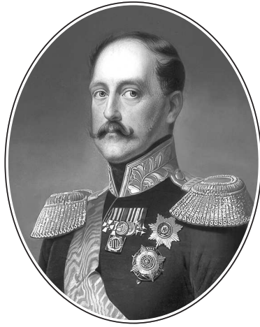
Император и самодержец всероссийский Николай I Павлович (1796–1855)

Присоединение в том или ином виде к Российской империи Сербии, Болгарии, Молдавии, Валахии, Галлиполи с Константинополем грозило Австрии обхватом русскими силами с востока, с севера, с юго-востока и с юга и потерей политической самостоятельности. Мало того, славянские народы самой Австрии — чехи, словаки, хорваты, русины, поляки — не могли бы остаться покорными верноподданными Габсбургского дома при таких переменах, и Австрийской империи грозил бы распад. Меттерних всегда этого боялся, его преемник Шварценберг — также, преемник Шварценберга по управлению министерством иностранных дел — тоже.