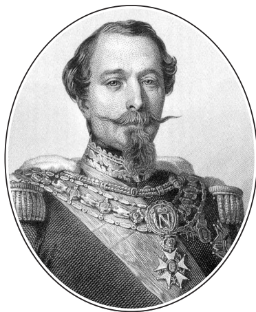
Первый президент Франции, единственный президент Второй республики (1848–1852), император французов (1852–1870) Наполеон III (1808–1873)

успокоился. Хребет революции сломен, но, конечно, и Кавеньяк, и избранный 10 декабря 1848 г. президентом принц Луи-Наполеон Бонапарт и не подумают бороться с ним, всемогущим борцом против революции, бдительным стражем порядка! Пришло и 2 декабря 1851 г., встреченное с восхищением в Зимнем дворце. Ночной налет, покончивший со Второй республикой, молодецкий расстрел генералом Сент-Арно безоружной толпы зрителей на Больших бульварах — все это очень понравилось царю. И хотя дальше последовали некоторые неприятности и принц-президент предпочел