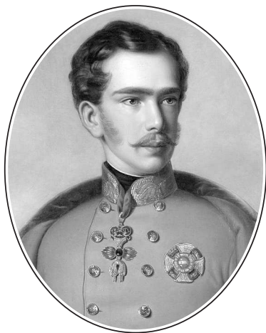
Император Австрии и король Венгрии, Богемии, Хорватии и Славонии, Галиции и Лодомерии Франц Иосиф I (1830–1916)

Тут снова повторилось то же, что было отмечено нами, когда мы говорили об Англии и Франции: в 1853–1854 гг. Николай был несравненно менее нужен Австрийской империи, чем в 1849 г., когда фельдмаршал Кабога орошал слезами ботфорты князя Паскевича. И все по той же причине: революционное движение было уже подавлено, новых вспышек не ждали, руки у Франца-Иосифа были развязаны. Мало того. Если бы даже и могло иметь хоть какое-нибудь значение «чувство благодарности» за спасение, то отдаться таким нереальным сентиментальностям нельзя было бы. Наполе-