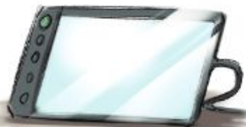
Графический планшет с монитором

Графический планшет с экраном подключается к компьютеру и используется в качестве второго монитора. Я использую этот планшет чаще всего. Они бывают разных размеров, но я бы рекомендовал планшет с диагональю не более 16 дюймов. Слишком большой планшет сложнее в обращении. Кроме того, от размера не зависит столь многое.