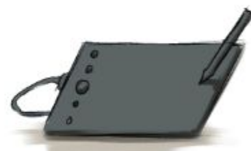
Планшет без экрана

Мобильный планшет — это, например, iPad, для которого можно приобрести карандаш для рисования. Это отличный вариант для начинающих! Я сам использую этот планшет, потому что мне нужно больше места для различных функций. Но для начинающих, у которых еще нет хорошего ПК, это действительно отличный выбор!