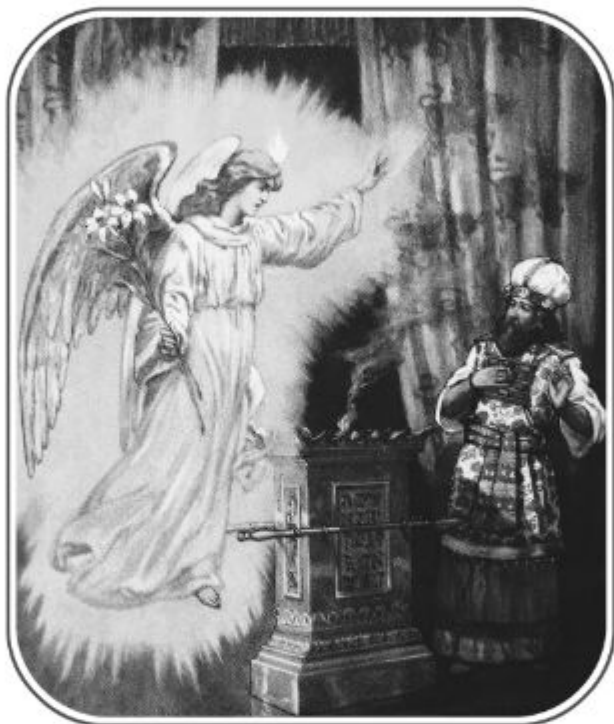
Явление Ангела Захарии