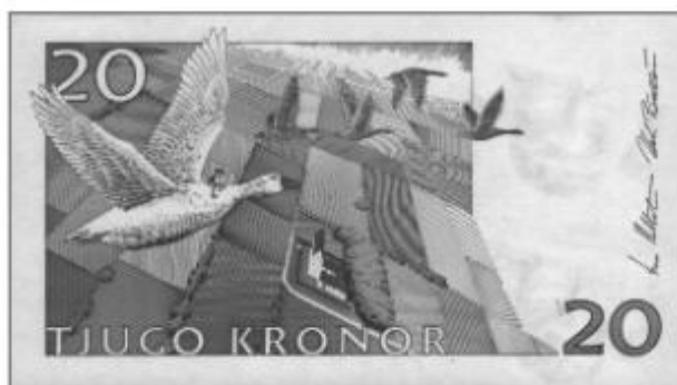
Рис. 1.1. Редкий случай, когда на банкноту попали литературные персонажи, вымышленные герои сказки

Тучки небесные, вечные странники! Степью лазурною, цепью жемчужною Мчитесь вы, будто как я же, изгнанники С милого севера в сторону южную.