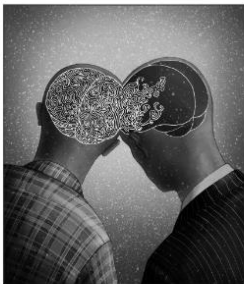
Рис. 1.2. Единомысленники думают друг о друга, взаимно щекочут мозги...

Смех читателя и связанное с ним удовольствие объясняются подсознательной гордостью за собственную способность мысленно восстановить это пропущенное звено. Именно поэтому шутки, которые надо объяснять, не смешны.