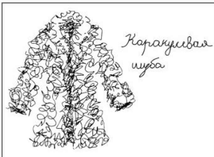
Рис. 1.7. Любовный фронт