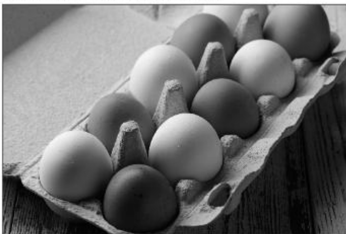
Рис. 1.3. Угадайте, кто из сотрудников уже побывал в отпуске

Вот теперь шутка готова. Разумеется, возможны и другие вариации (рис. 1.3).