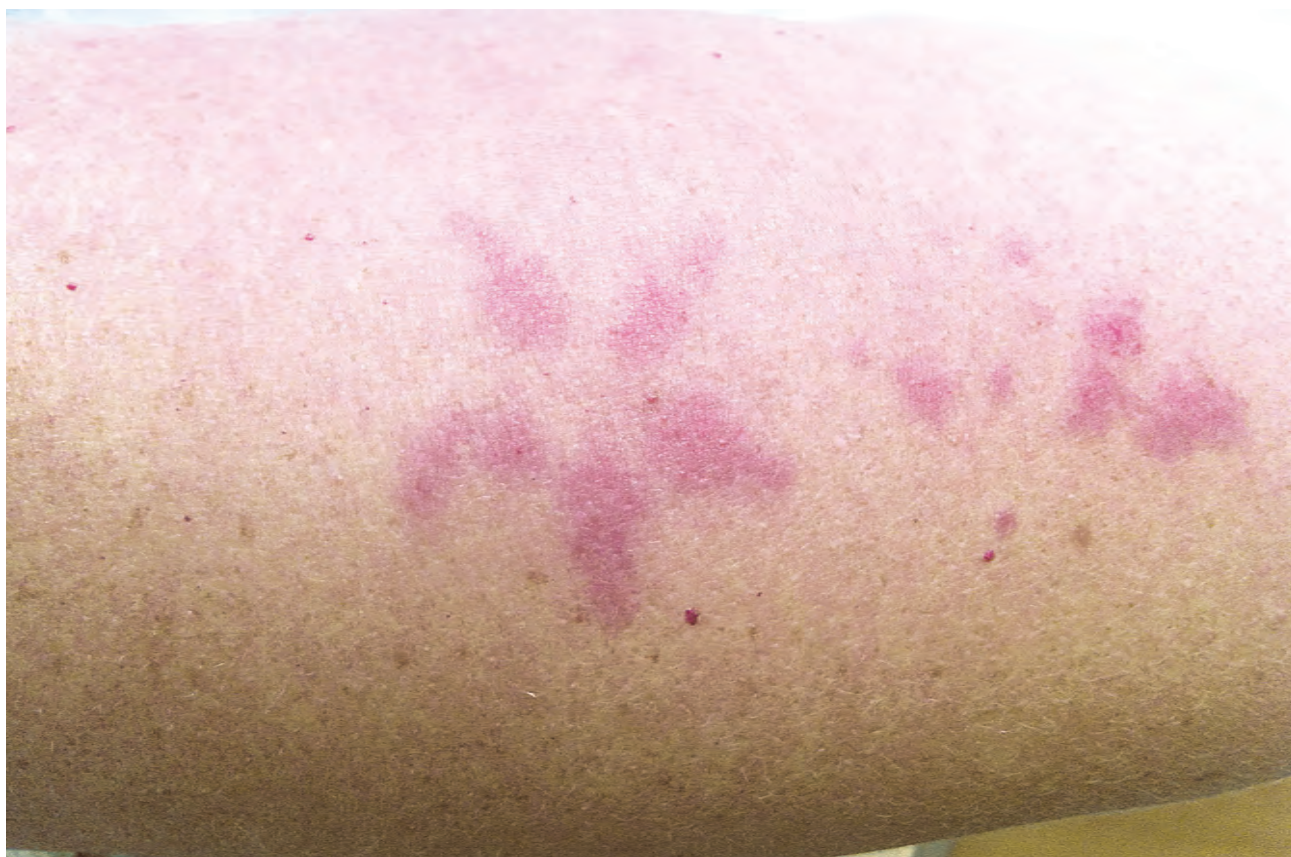
Рис. 1.5. Дерматит простой (после выведения татуировки лазером)