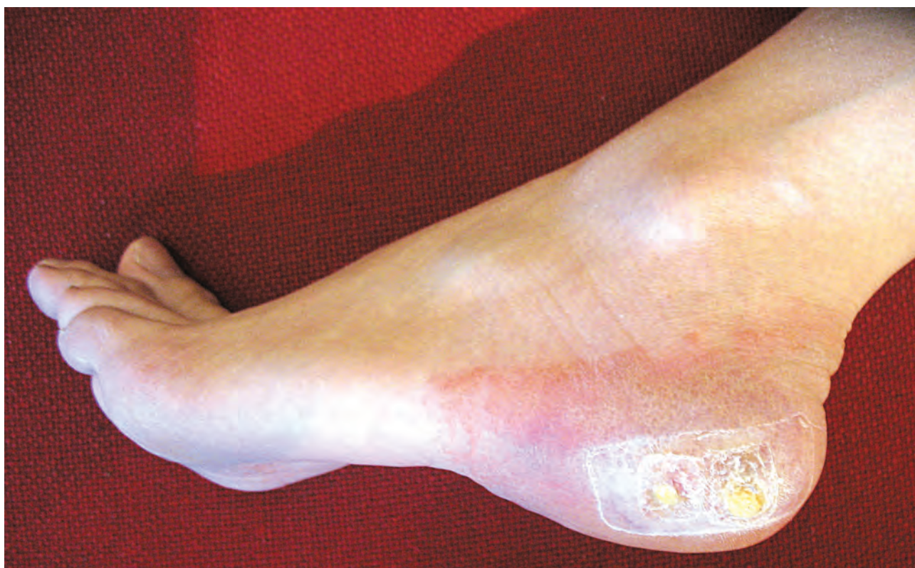
Рис. 1.2. Дерматит аллергический (применение салипода)