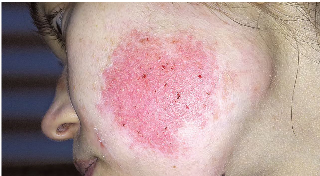
Рис. 1.1. Дерматит аллергический медикаментозный