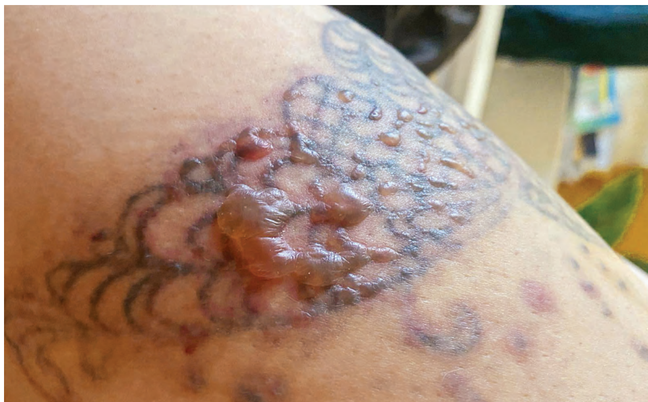
Рис. 1.6. Простой контактный дерматит