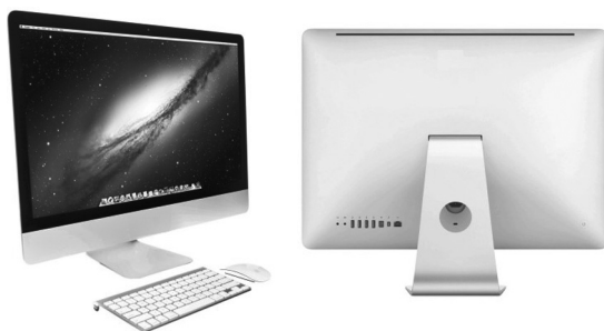
Рис. 2.6. Внешний вид современного моноблока

ствуется. Все комплектующие для моноблоков специально разработаны и переделаны под новый компьютерный стандарт, чтобы уместить их под тонким дисплеем. С виду моноблок выглядит как обычный монитор, но по бокам и на задней стенке у него находятся всевозможные разъемы, а у некоторых моделей и DVD-привод (рис. 2.6). В связи с тем, что все комплектующие встроены в дисплей устройства, нет необходимости в лишних проводах, тянущихся от монитора к системному блоку. Традиционная для большинства моделей комплектация беспроводной клавиатурой и мышью также вписывается в концепцию «минимум проводов».