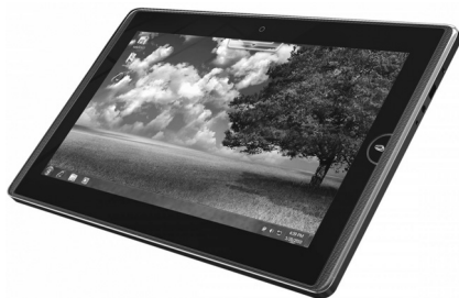
Рис. 2.8. Планшетный компьютер