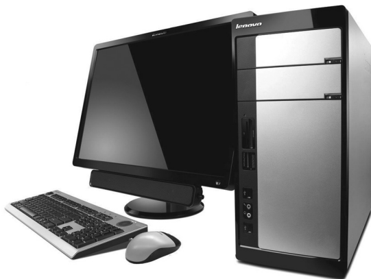
Рис. 2.5. Стационарный компьютер

Стационарные ПК — настольные ЭВМ, состоящие из системного блока, клавиатуры для ввода информации, монитора, предназначенного для отображения информации, и мыши (рис. 2.5).