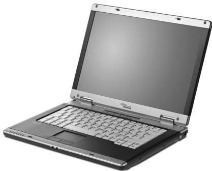
Рис. 2.7. Ноутбук

Ноутбуки-трансформеры — это отдельный класс устройств, в котором идеально сочетаются преимущества планшета и вычислительной машины с клавиатурой (ноутбука). Сенсорное управление является одной из сильных сторон таких устройств. Ими можно управлять с помощью пальцев (или стилуса) без использования мыши. Интерфейс у них ориентирован на использование возможностей сенсорного