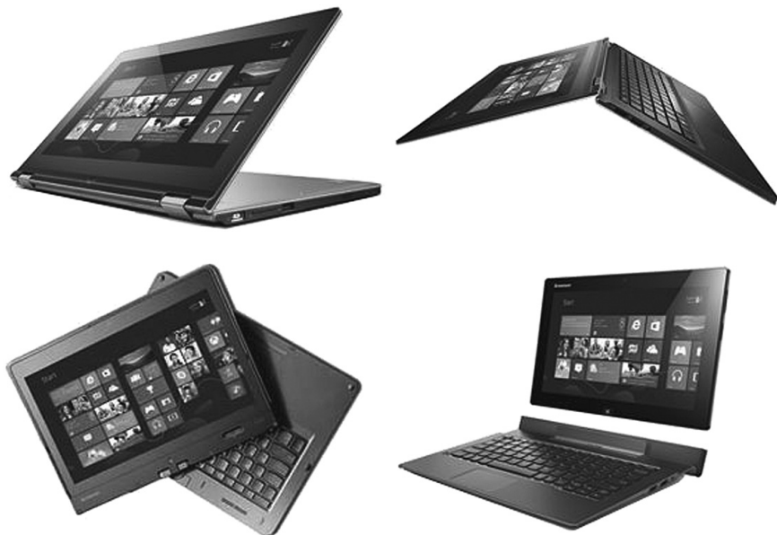
Рис. 2.9. Ноутбуки-трансформеры

ввода. Такие ноутбуки являются симбиозом функциональности и производительности, со всеми удобствами применения. Большинство современных ноутбуков не имеет сенсорного дисплея, а для их использования нужна горизонтальная поверхность. Ноутбуки-трансформеры, обладая всеми преимуществами обычных ноутбуков, предоставляют пользователю более высокую гибкость и легко превращаются в планшеты, которые удерживаются на ладони (рис. 2.9).