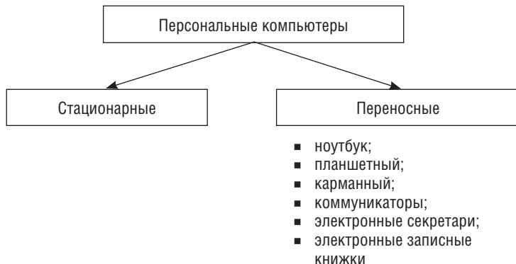
Рис. 2.4. Классификация ПК

обработке или получению необходимой информации, может подобрать ПК, отвечающий его запросам и финансовым возможностям. На рис. 2.4 приведена классификация ПК.