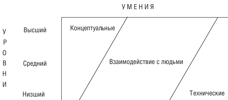
Рис. 2-2. Управленческие умения

консультировать, советовать, аттестовывать своих сотрудников и в целом способствовать развитию персонала.