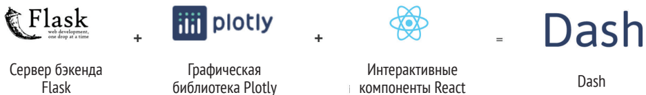
Рис. 1.1. Из чего сделан Dash

Хотя в этом нет строгой необходимости, все же вам полезно будет узнать, какие основные компоненты используются в Dash , чтобы уверенно чувствовать себя при разработке более сложных приложений и знать, куда обращаться за помощью.