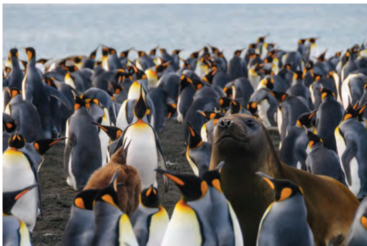
Рис. 1.2 ❖ На этой фотографии запечатлен тюлень среди пингвинов

Большинство опрошенных наверняка ответят, что тюлень в окружении пингвинов – явление весьма необычное. Но людям бывает сложно сформулировать в явных терминах эвристику, которая лежит в основе таких выводов.