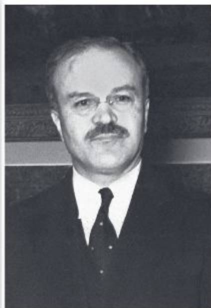
МОЛОТОВ Вячеслав Михайлович (09.03.1890–08.11.1986)

Советской стороной предпринимались неоднократные попытки дипломатическим путем договориться с финской стороной о переносе границы. Предлагалось отодвинуть границу примерно до линии Приморска (Койвисто, фин.), считалось, что 70 км до Ленинграда — нормально, ни Выборг (Вийпури, фин.), ни Приозерск (Кякисалми, фин.) СССР не просил. Финляндия была готова отдать только Зеленогорск (Терийоки, фин.) с Репино (Куоккала, фин.), т.е. перенести границу на 10–12 км вглубь Карельского перешейка, и изъявила готовность передать Советскому Союзу 2 из 4 требуемых островов в целях «обеспечения безопасности акватории Финского залива». Однако Советский Союз это категорически не устраивало... 1 С каждой новой встречей тон переговоров становился все жестче. Позиция Советского Союза, сформулированная Сталиным в ходе переговоров, была четкой и недвусмысленной: «Мы просим, чтобы расстояние от Ленинграда до линии границы было бы семьдесят километров. Таковы наши минимальные требования, и вы не должны думать, что мы уменьшим их. Мы не можем передвинуть Ленинград, поэтому линия границы должна быть перенесена» 2 .