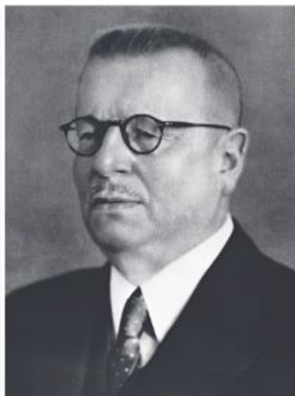
ПААСИКИВИ Ю́хо Ку́сти (27.01.1870–14.12.1956)

опытнейший переговорщик, посол Финляндии в Швеции Юхо Кусти Паасикиви.