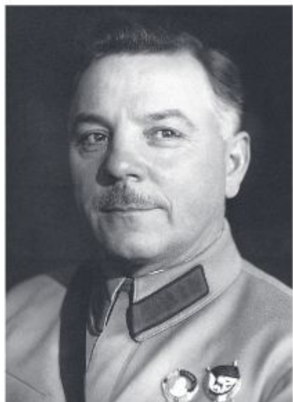
ВОРОШИЛОВ Климент Ефремович (04.02.1881–02.12.1969)

После войны Председатель Союзной контрольной комиссии в Венгрии. Заместитель Председателя Совета Министров СССР (1946–1953). Председатель Президиума Верховного Совета СССР (1953–1960) 2 . Член ЦК КПСС [ВКП(б)] (1921–1961). Член Политбюро ЦК КПСС [ВКП(б)] (1926–1960).