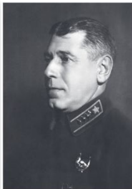
ШАПОШНИКОВ Борис Михайлович (02.10.1882–26.03.1945)

Шапошников Б.М. 1,2 — начальник Генштаба РККА, Маршал Советского Союза.