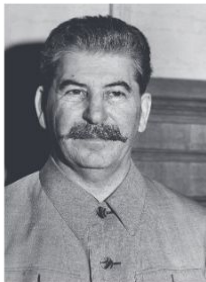
СТАЛИН Иосиф Виссарионович (18.12.1878–05.03.1953)

С финской стороны в переговорах участвовали также посол Финляндии