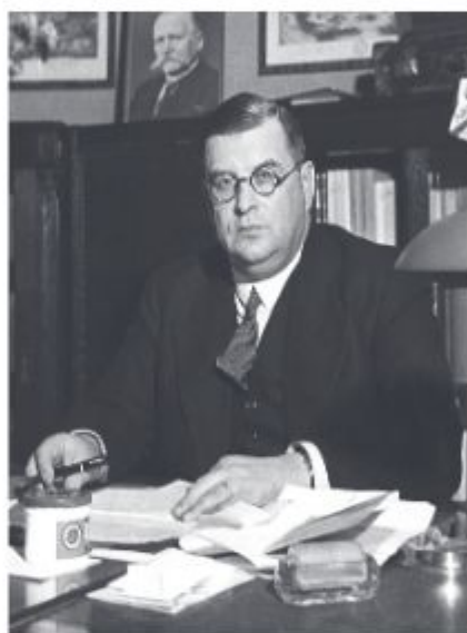
ЭРККО Юхо Элиас (01.06.1895–20.02.1965)

Образование: среднее военное — Военная школа Вимпели (1918), высшее, магистр в области права, Хельсинкский университет (1922). Владелец влиятельной газеты «Хесингин Саномат», вел пропаганду «слабости СССР» (1937–1938). Министр иностранных дел Финляндии (12.1938–12.1939). посол в Швеции (1939–1940), глава офиса советских военнопленных в Финляндии (1940–1942). После войны предстал перед военным трибуналом, в 1946 г. обвинения были сняты. В последующие годы — генеральный директор и Председатель совета директоров медиаконцерна «Sanoma» 2 .