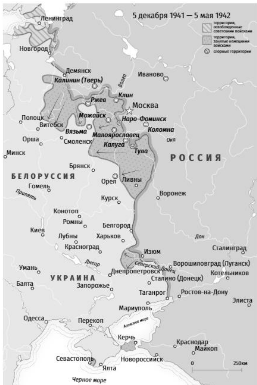
Карта 3. Линия фронта. 5 декабря 1941 года — 5 мая 1942 года