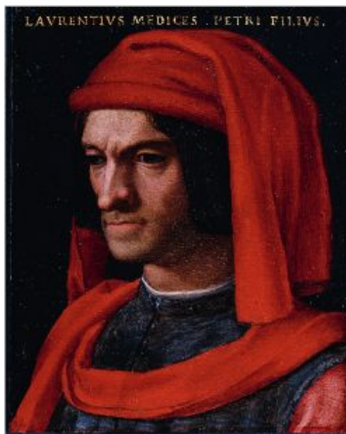
Аньоло Бронзино, портрет Лоренцо Медичи, м-ду 1565-69 гг.

Ее прадедушка – Лоренцо Медичи Великолепный, покровитель Леонардо и Боттичелли, а его младший брат Джулиано когда-то был влюблен в самую красивую девушку Флоренции – Симонетту Веспуччи. Конечно, Екатерина Медичи узнает эту историю любви, когда подрастет.