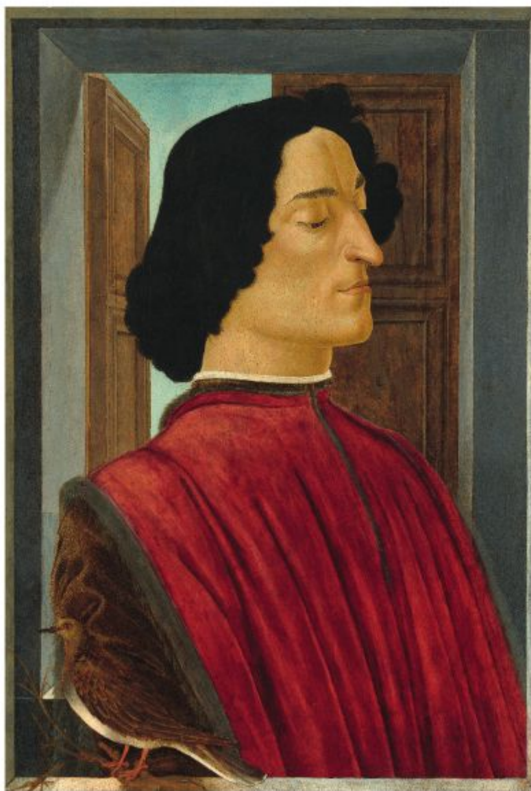
Сандро Боттичелли, портрет Джулиано Медичи, 1478-80 гг.