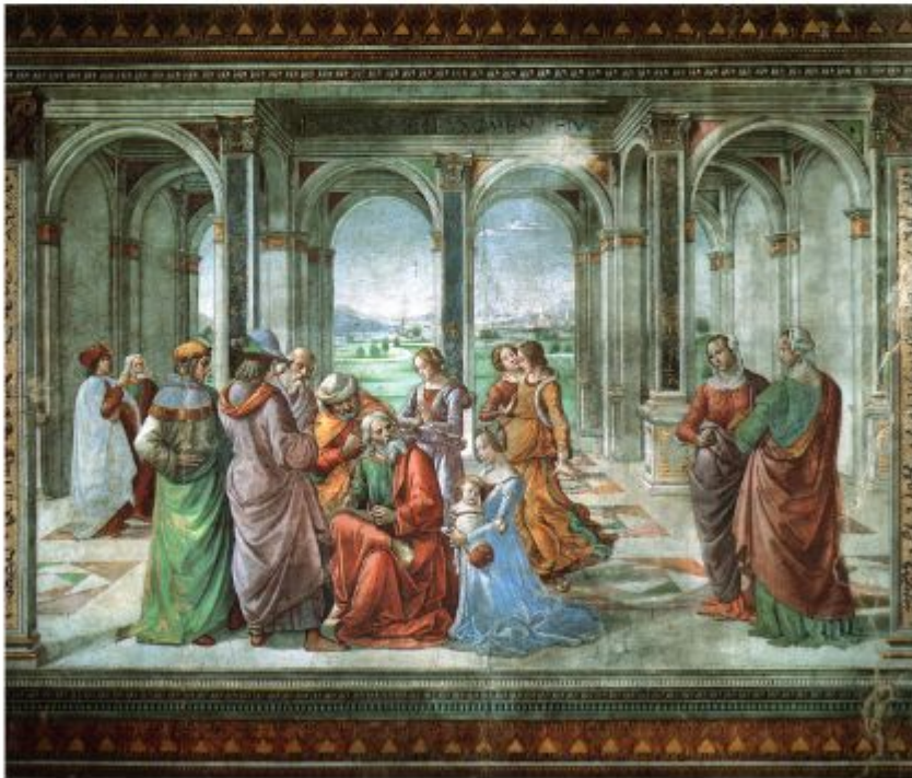
Доменико Гирландайо, «Захария записывает имя своего сына», фреска в церкви Санта-Мария Новелла, 2 пол. XV в.

Если выйти на улицу, краем уха можно услышать последние новости со всех концов света – год богат на события. Испанцы начали завоевание Мексики. Империя ацтеков обречена. Второго мая скончался во Франции Леонардо да Винчи – да, вдали от родной Италии, но зато на руках короля Франциска I, его друга.