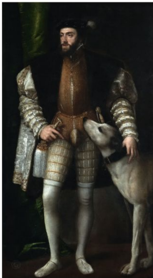
Тициан, портрет Карла V с собакой, 1533 г.