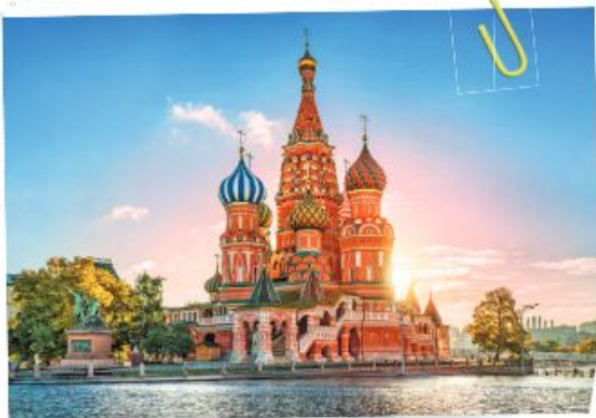
Храм Василия Блаженного

— Именно здесь мы увидим одно из семи чудес России — собор Покрова Пресвятой Богородицы, что на Рву.