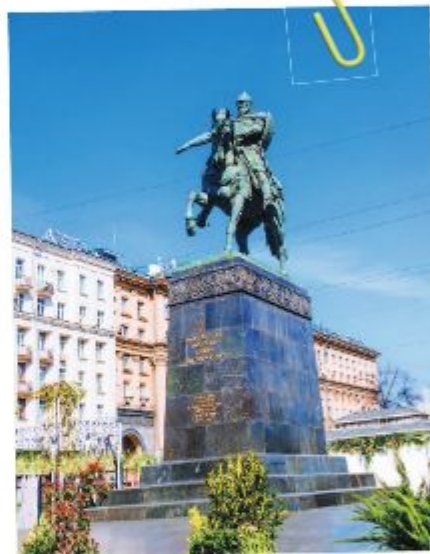
Памятник Юрию Долгорукому

КРЕМЛЯМИ на Руси называли крепости. Другое их название — детинцы, как в Новгороде. Московский кремль был возведен на Боровицком холме, окруженном двумя реками: Москвой-рекой и Неглинной. Основал эту крепость еще в XII веке князь Юрий Долгорукий, и первое упоминание в летописи о ней было в 1147 году.