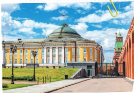
Сенатский дворец Московского кремля

страны. В том виде, из красного кирпича, к которому мы давно привыкли, крепость была построена при Иване III Великом в 1485–1495 годах.