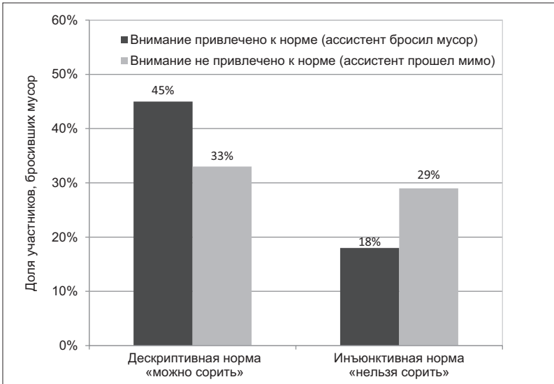
Рисунок 1.1. Доля испытуемых, которые сорили на парковке либо сильно замусоренной (дескриптивная норма «можно сорить»), либо чисто выметенной, с мусором, собранным в кучи (инъюнктивная норма «нельзя сорить»). Эти нормы актуализировал ассистент экспериментатора: он бросал мусор под ноги на глазах у испытуемого, тем самым привлекая его внимание к состоянию парковки

задания, испытуемый должен был распределить между собой и своим анонимным партнером 15 долларов одним из двух следующих способов: в варианте А участник эксперимента оставлял себе десять, а незнакомцу отдавал пять долларов, а в варианте Б — наоборот. Но о том, как поделены деньги, знал только он сам.