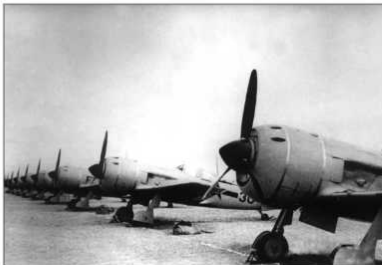
Истребители Ла-9 ВВС КНР

Авиация Гоминьдана периодически бомбила города материкового Китая, прежде всего — Шанхай и окрестности. Малочисленная авиация НОАК не име-