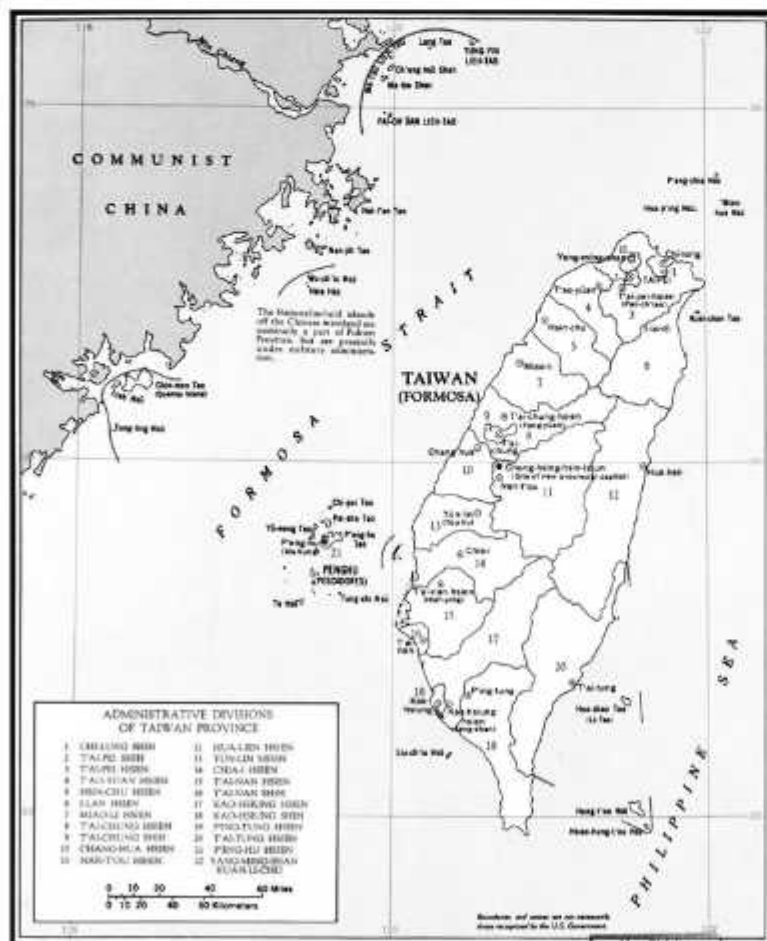
Карта Тайваньского пролива

Разгром вооруженных сил Гоминьдана был предопределен. Для восстановления боеспособности после поражения требовался известный временной период, в течение которого противник не должен иметь возможности нанести окончательный до-