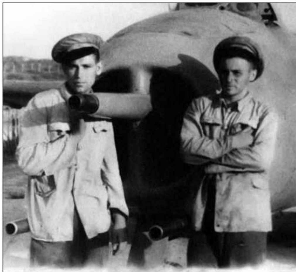
Советские инструкторы у истребителя МиГ-9 ВВС КНР

В Корейской войне, на ротационной основе, принимали участие четыре китайские авиадивизии. Первой в декабре 1950 г. в Аньдун перебросили 4-ю дивизию. К концу Корейской войны, в 1953 г., ВВС КНР располагали 28 авиационными дивизиями (70 авиационных полков) и пятью отдельными авиаполками. На вооружении состояло более 3000 самолетов.