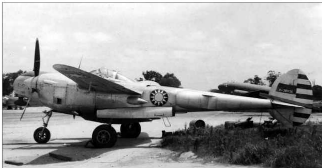
В годы Второй мировой войны китайские ВВС получили примерно 20-30 самолетов P-38 «Лайтнинг», примерно половину из них составляли фоторазведчики F-5G. Снимок китайского разведчика F-5G сделан в 1946 г.

Первый блин оказался комом, зато потом дела пошли лучше. В феврале — мае 1950 г. войска Гоминьдана выбили с Хайнаня,