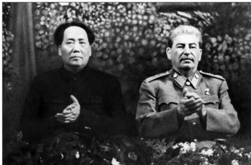
Мао Цзэдун и И. В. Сталин, 16 декабря 1949 г.

Народно-освободительной армии Китая», именно эта дата является днем образования ВВС КНР