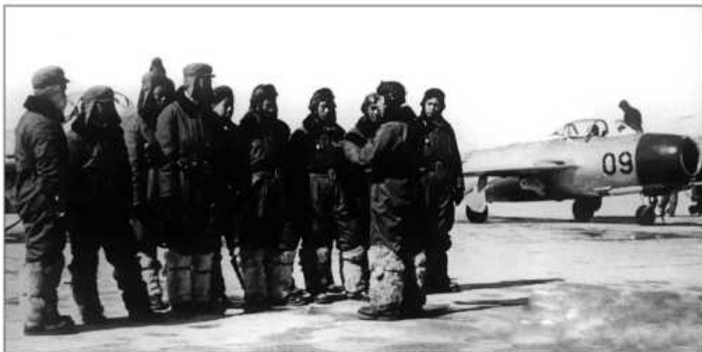
Истребители МиГ-15 и летчики 4-й ИАД ВВС КНР, на самолеты нанесены опознавательные знаки ВВС КНДР, аэродром Аньдун, январь 1951 г.

вободили нашу деревню, вступил в ряды НОАК. Мне тогда было 16 лет, учился я всего один год. В июне 1950 г., в ответ на призыв Председателя Мао строить сильные ВВС, принял решение стать летчиком. К моменту отправки на войну я налетал 100 ч., из них 30 на МиГ-15.