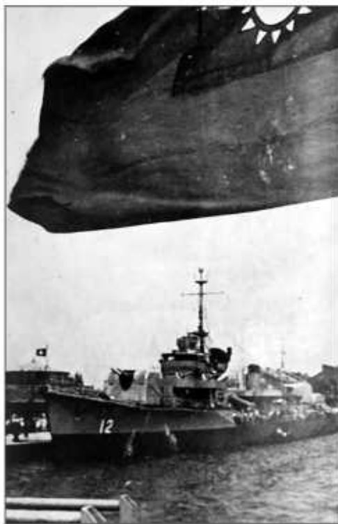
Флагман ВМС Китайской республики эсминец «Даньян» в Маниле, 1953 г.

Пиратам, «националистическим партизанам» (nationalist guerrillero), приписывают захват недалеко от Фучжоу, провинция Фуцзянь, 8 сентября 1952 г. британского торгового судна «Admiral Hardy» (водоизмеще-