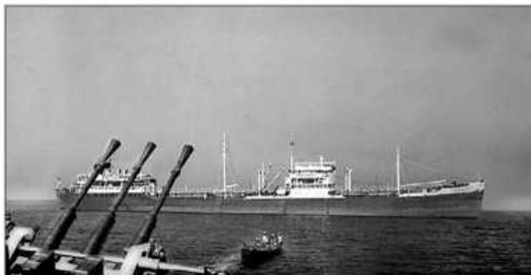
Танкер «Туапсе». Фото сделано с борта корабля ВМС Китайской республики

Торговые суда останавливали, досматривали и зачищали не одни лишь корабли ВМС Китайской республики. Жители прибрежных островов имели вековые традиции несогласованного с властями досмотра торговых судов с последующим освобождением их от полезной нагрузки.