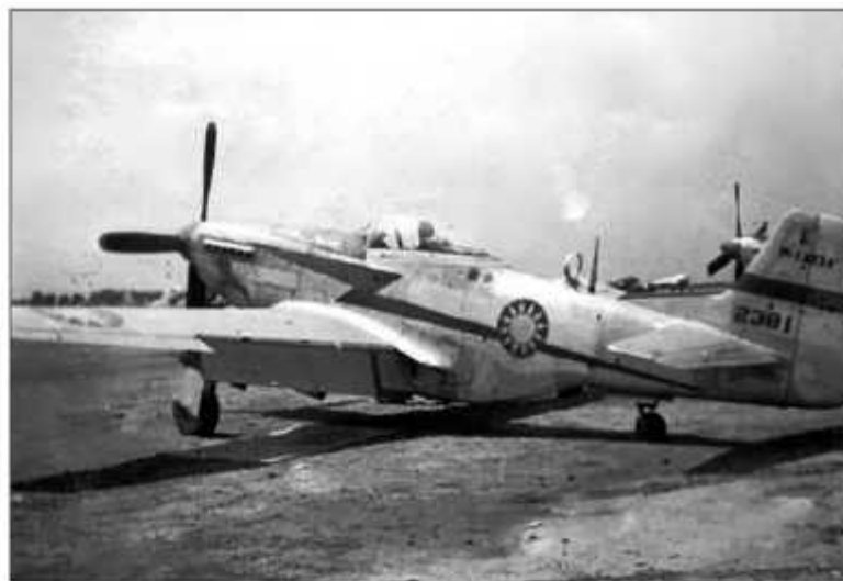
Истребитель P-51D «Мустанг» ВВС националистов, снимок 1946–1947 гг. В 50-е гг., вслед за США, обозначения истребителей ВВС Китайской республики изменили с P (Pursuit) на F (Fighter), P-51 превратился в F-51

Выбить Гоминьдан с прибрежных островов (не только с о. Цзиньмэнь) не удалось. Десантная операция требовала тесного взаимодействия разнородных сил — армии, флота и авиации. Опытом такого взаимодействия НОАК не обладала. Первая волна десанта (8736 человек) пересекла пролив на 300 рыбацких лодках. Эти же лодки должны были доставить вторую волну — 11 000 бойцов и командиров. Доставили же всего 350 человек. Практически все десантно-высадочные, с позволения сказать, средства были уничтожены при высадке первой волны. Авиационной поддержки десанта не было вообще, в то время как Гоминьдан задействовал в боях 75 бомбардировщиков В-25, которые выполнили более 200 самолето-вылетов. «Флоту вторжения» противостояли девять самых настоящих военных кораблей, в том числе эскортный эсминец «Тайпинь» типа «Эвартс» (бывший корабль ВМС США «Деккер», вошел в боевой состав ВМС США в 1943 г., в августе 1945 г. передан Китаю). Свою роль сыграла ошибка разведки, сильно занижившей числен-