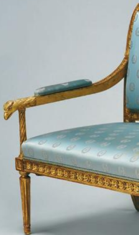
Воронихин А. Н. Диван. 1803. Был создан для великой княгини Марии Павловны. Метрополитен-музей, США