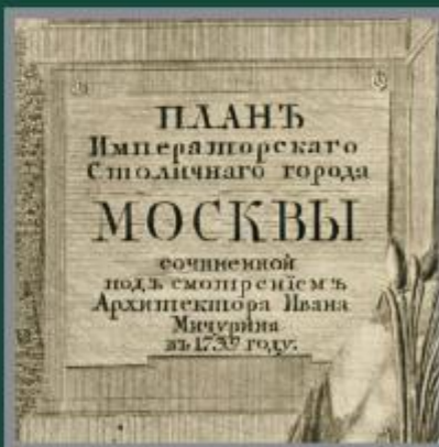
План императорского столичного города Москвы. 1745