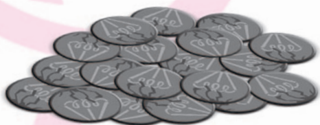
Игровые жетоны треснувших лампочек