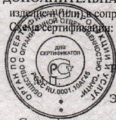
Схема сертификации: 1

ДОПОЛНИТЕЛЬНАЯ ИНФОРМАЦИЯ Знак соответствия по ГОСТ Р 50460-92 наносится на изделие(и) в сопроводительной технической документации.