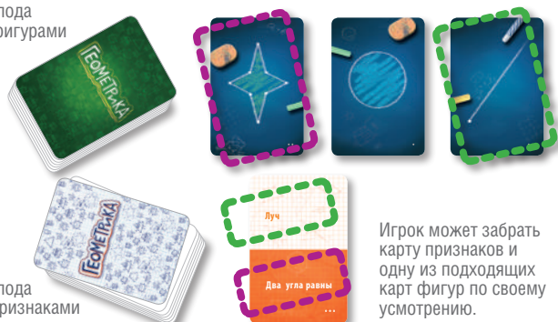
Колода с признаками

Игрок может забрать карту признаков и одну из подходящих карт фигур по своему усмотрению.